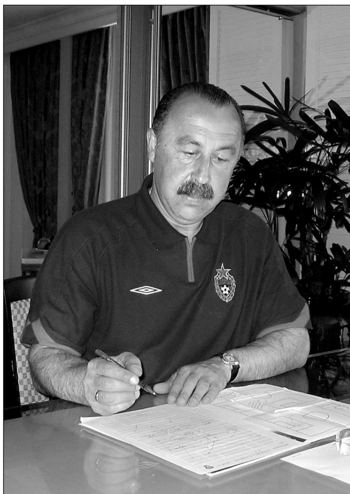
Вчера, Ницца. Валерий ГАЗЗАЕВ в своем номере отеля Le Meridien.

Подробности матча Лиги чемпионов «Ливерпуль» - ЦСКА Сф - стр. 3