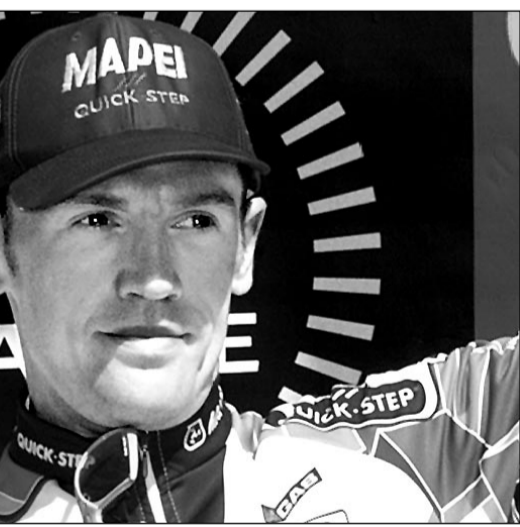
Вчера. Лаваль. Том СТЕЕЛС после финиша 3-го этапа.

Общий зачет. 1. Кирсипу - 13:18.59. 2. Стеелс - отставание 0.17. 3. О'Грайди - 0.20. 4. Ланс Армстронг (США, «Ю. Эс. Постал») - 0.20. 5. Абдрахам Олао (Испания, ОНСЕ) - 0.31. 6. Хинкзипи - 0.34. 7. Кристоф Моро (Франция, «Фестина») - 0.35. 8. Цабель - 0.40. 9. Александр Винокуров (Казахстан, «Казино») - 0.41. 10. Сантос Гонсалес (Испания, ОНСЕ) - 0.41... 15. Павел Тонков (Россия, «Мапеи») - 0.48.