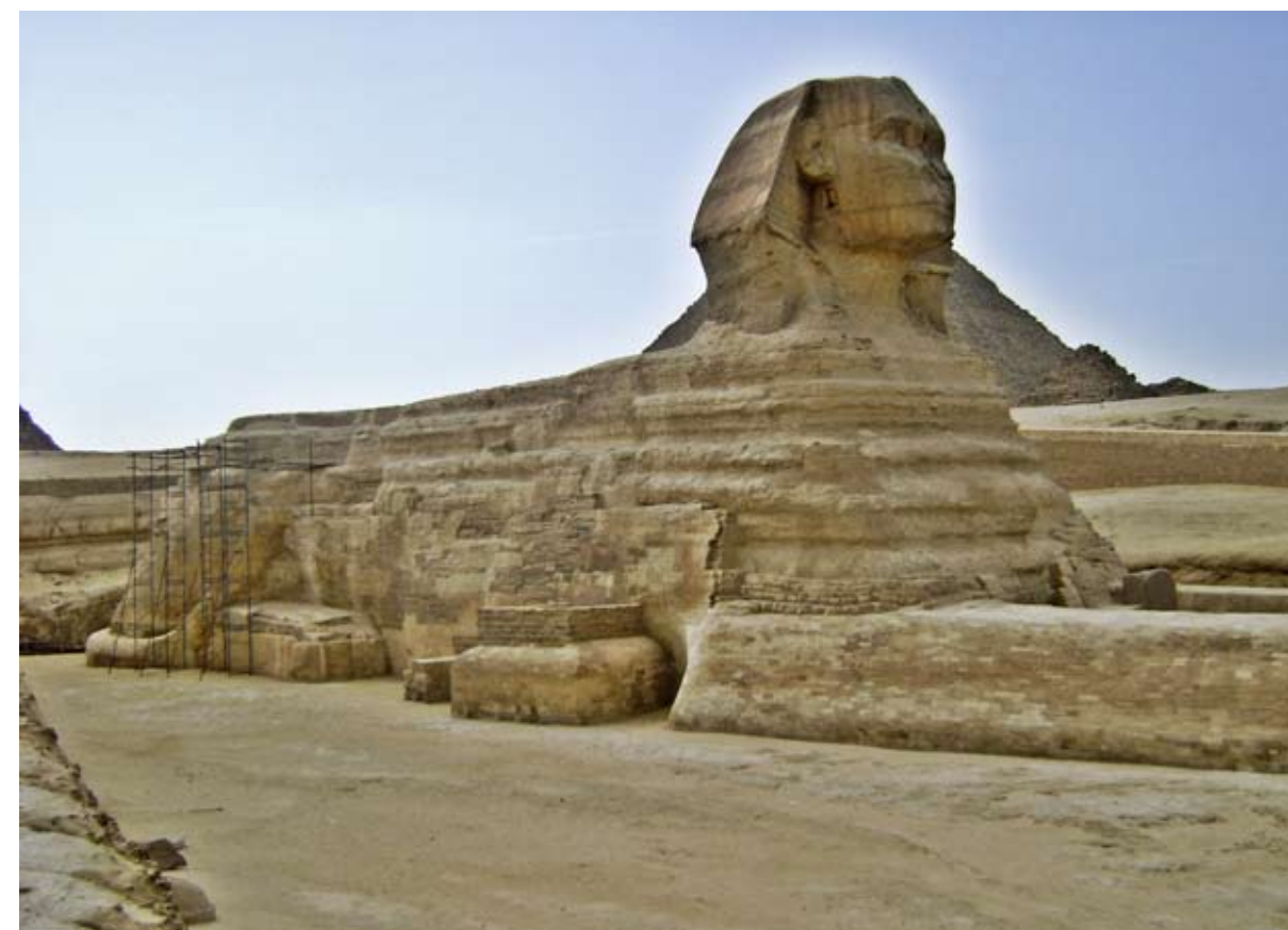
Сфинкс - чудовище с туловищем льва и головой фараона Хефрена, охраняющее великие пирамиды на плато Гизы. Это самая большая статуя в мире, вырубленная из камня