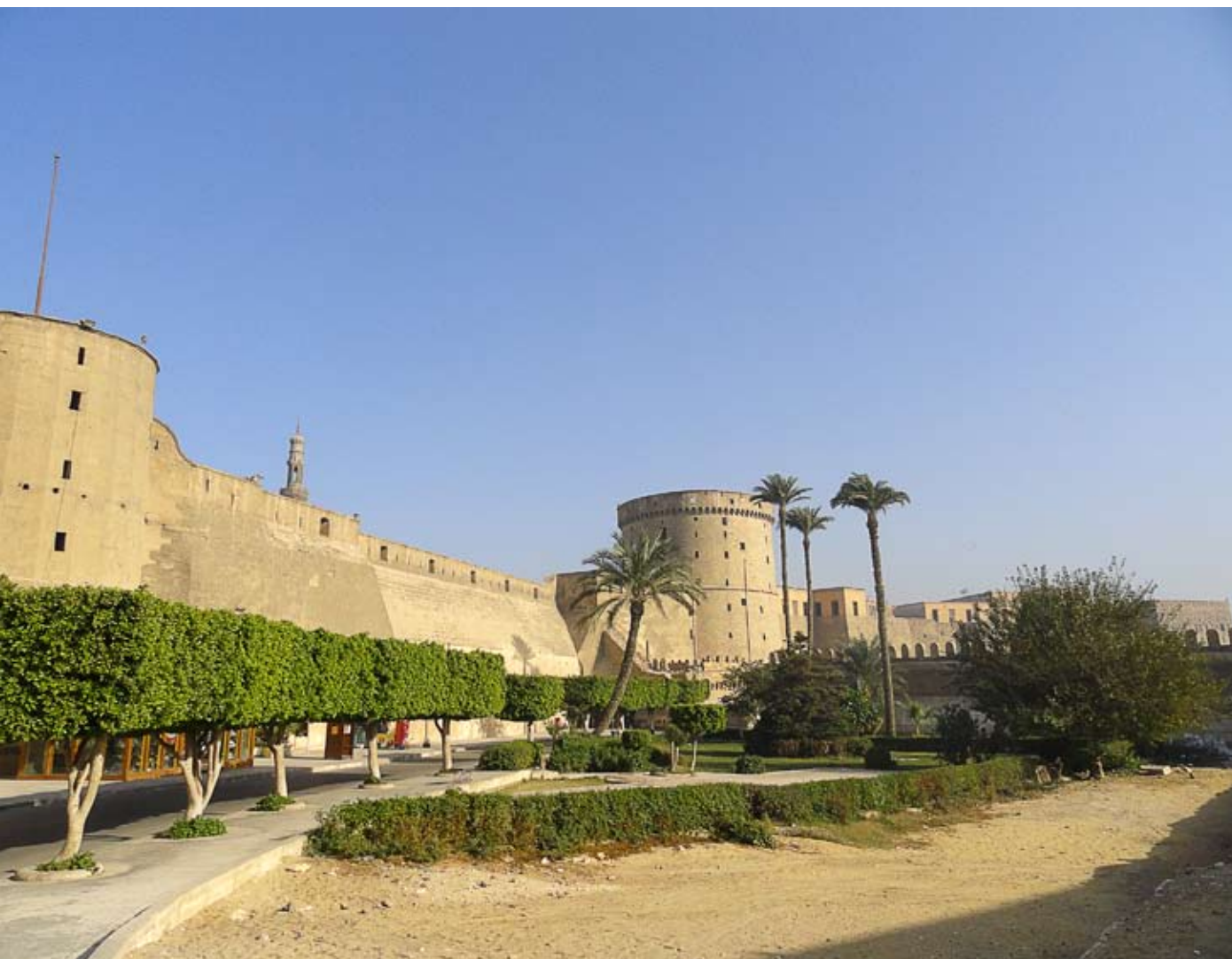
Цитадель Каира, построенная при султане Саладдине

султан Саладдин. Укрепляя армию для борьбы с крестоносцами, Айюбиды набирали мамлюков (воинов, рекрутировавшихся из рабов), которые в 40-х гг. XIII в. составляли уже значительную часть армии. Мамлюкские военачальники стали диктовать свою волю правителям Египта, а в 1250 г. свергли султана и правили страной до 1517 года. (А 8. Цитадель Каира, построенная при султане Саладдине)