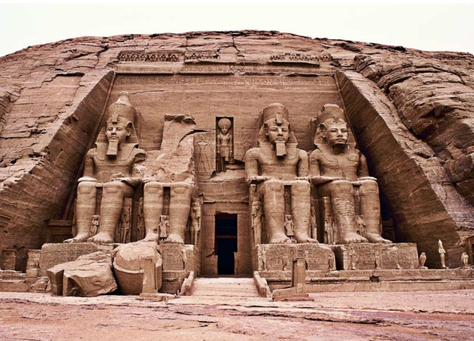
Храм Рамсеса II, вырубленный в скале в Абу-Симбеле

Египет можно назвать страной чудес и тайн — великие пирамиды, большой сфинкс, огромные храмовые комплексы в Карнаке и Луксоре, величественные монолитные обелиски, колоссы Рамсеса II и вырубленный в скале храм в Абу-Симбеле поражают как древних, так и современных путешественников. Как египтяне строили эти величественные сооружения, как мумифицировали умерших, как они достигли обширных знаний в математике, астрономии, медицине и многих других отраслях знаний, является загадкой. На сегодняшний день в Египте работают около 150 археологических экспедиций, шаг за шагом открывающих тайны этой удивительной североафриканской страны. ●