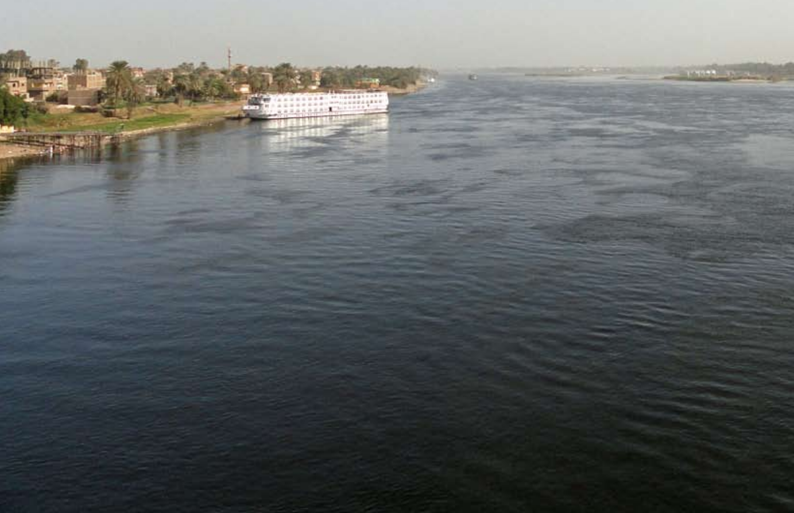
Нил в районе Луксора