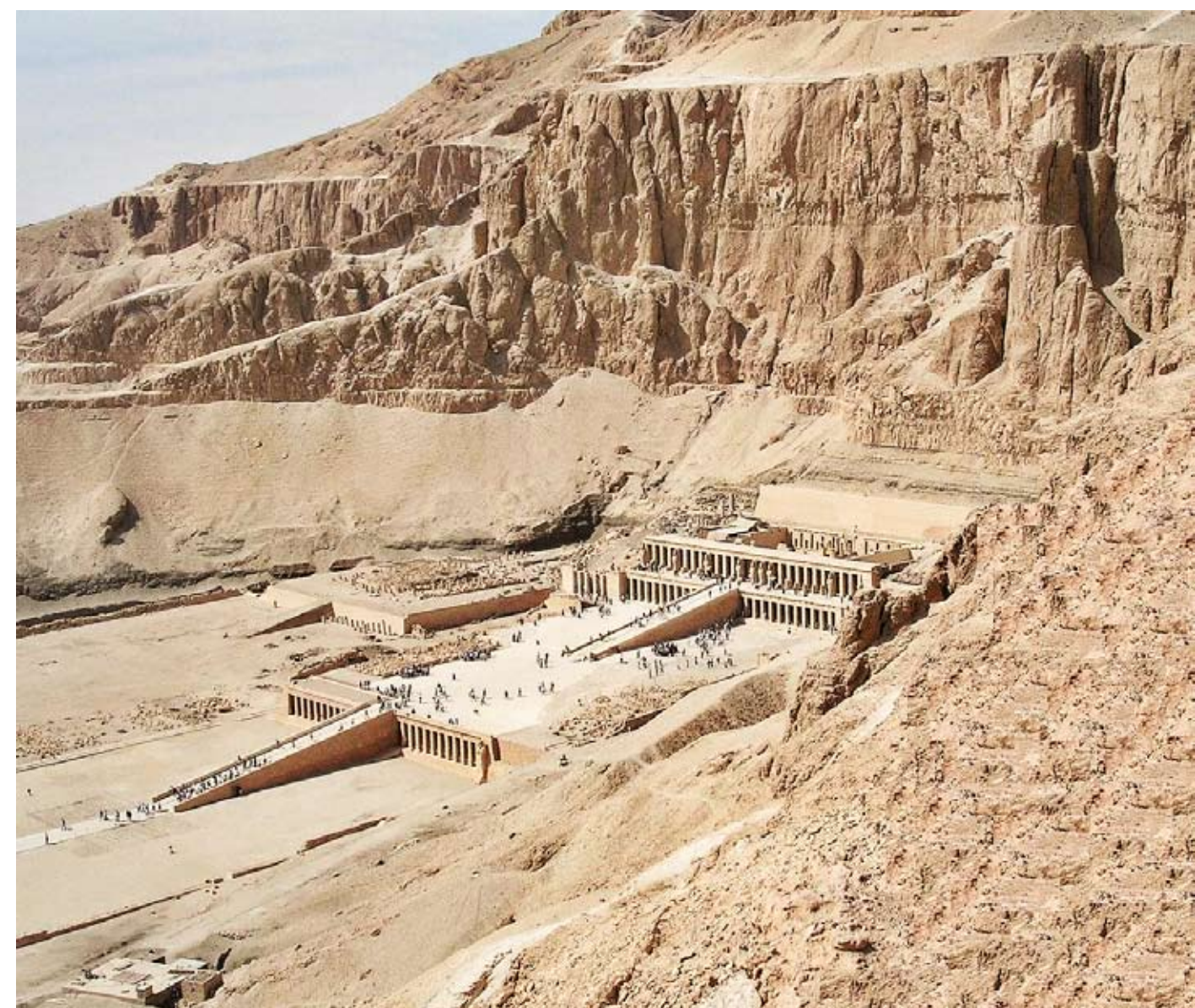
Заупокойный храм царицы Хатшепсут в Дейр-эль-Бахри в окрестностях г. Луксора

Во времена Древнего (Старого) царства (2635-2215 гг. до н.э.) начали возводить гигантские пирамиды. Фараону Джосеру (2630-2611 гг. до н.э.) принадлежит ступенчатая пирамида в Саккаре — первая пирамида в Египте и, вероятно, древнейшее монументальное каменное сооружение в мировой истории. На плато Гизы построили всемирно известные пирамиды фараона Хуфу (греч. Хеопс, 2551-2528 гг. до н.э.) высотой 146,6 м, его сына Хафра (греч. Хефрен, 2520-2494 гг. до н.э.), высотой 143 м и внука Менкаура (греч. Микерин, 2490-2472 гг. до н.э.) высотой 68 м, до сих пор поражающие своим величием