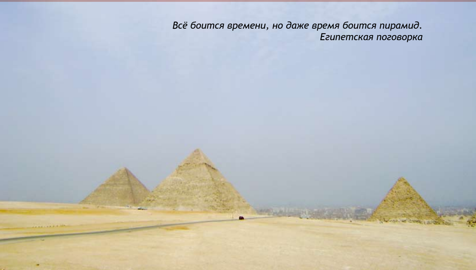
Вид на пирамиды Гизы

Всё боится времени, но даже время боится пирамид. Египетская поговорка