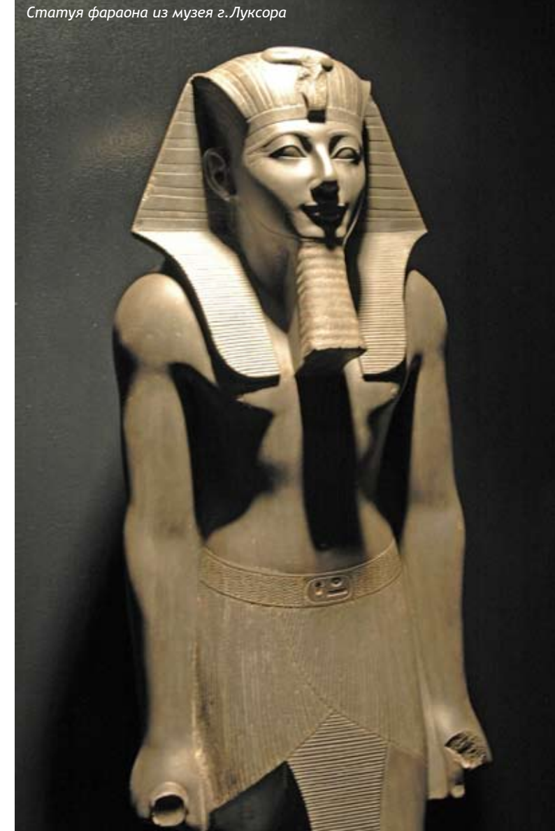
Статуя фараона из музея г. Луксора

Между богами и фараонами как бы существовал неукоснительно соблюдавшийся нерушимый «договор», основанный на принципе «do ut des» («даю, чтобы ты дал»), - боги даровали фараону долголетие, личное благополучие и процветание государства. Правитель Египта, со своей стороны, обеспечивал богам соблюдение культа, строительство храмов и прочее.