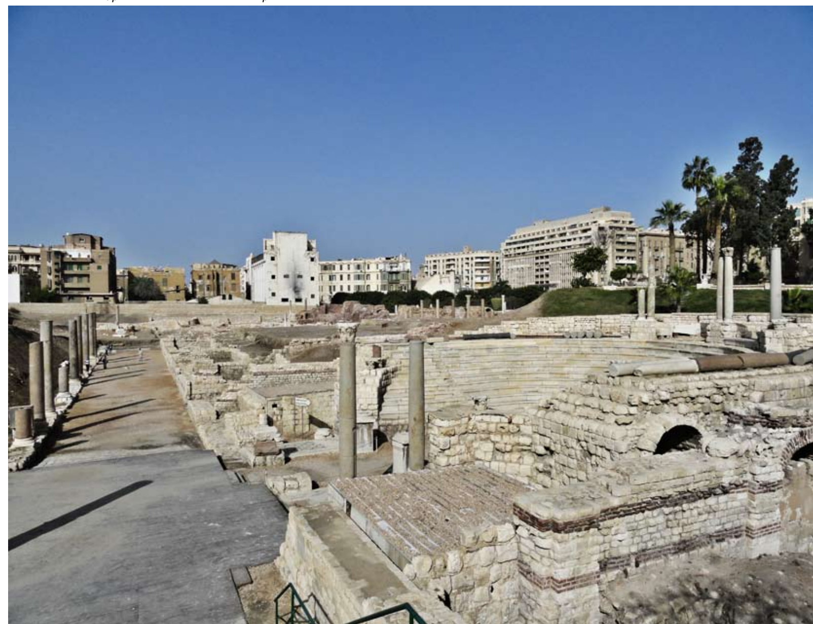
Фрагмент античной Александрии

Император Октавиан Август (30 до н.э.-14 гг. н.э.)