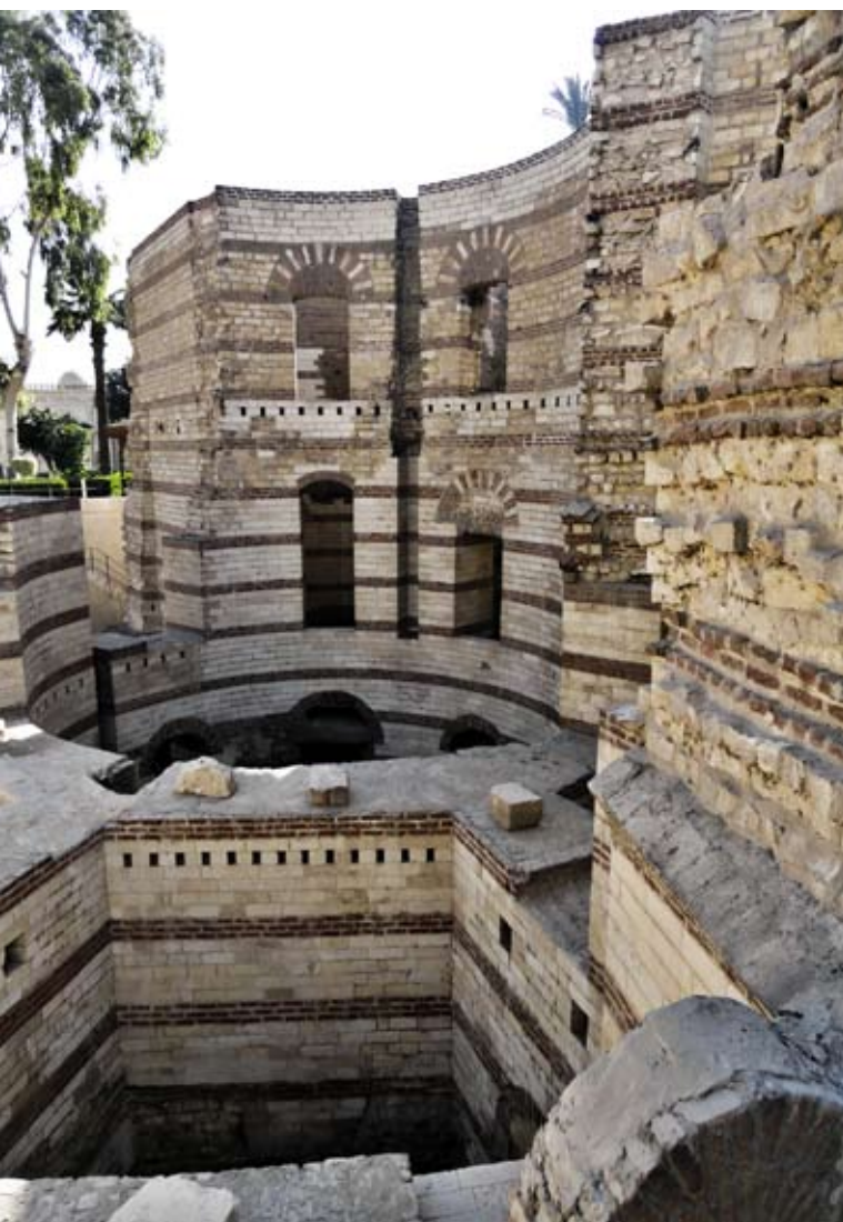
Римская крепость в Вавилоне Египетском

ввёл в Египте режим своего прямого правления. Существовала должность префекта Египта, в распоряжении которого находилось три легиона (Никополь, Вавилон и Фивы).