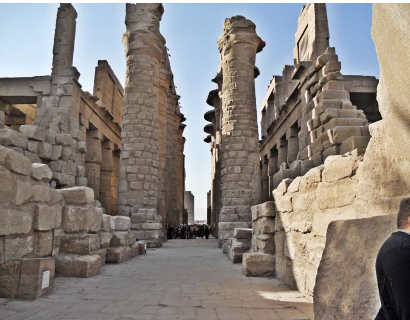
Гипостильный (т.е. поддерживаемый очень часто поставленными колоннами) зал Рамсеса II в Карнакском храмовом комплексе

рабов, завершилось дарованием Десяти заповедей и установлением Ветхого Завета. На базальтовой стеле сына Рамсеса II Мернептаха (1224-1214 гг. до н.э.), находящейся ныне в Египетском национальном музее в Каире, присутствует единственное среди всех древнеегипетских источников упоминание этнического определения «Израиль».