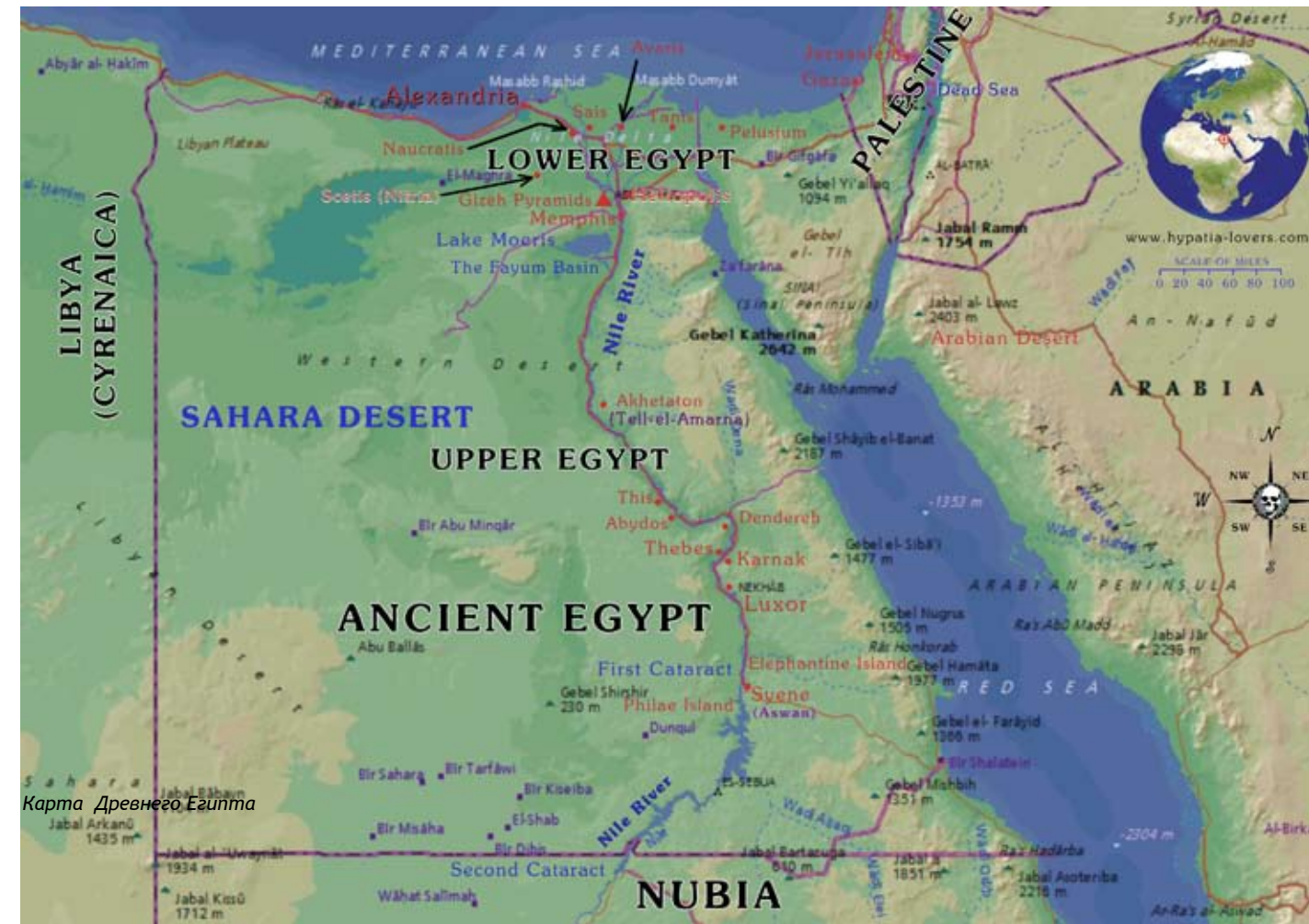
Карта Древнего Египта

Египет с глубокой древности и до настоящего дня представляет собой бескрайние пустыни и узкую полосу земли, где только и возможна жизнь (долина Нила, самой протяженной реки в мире – 6671 км). Далеко не случайно древние израильтяне называли Египет «мицраим», т.е. «узкое место», и, действительно, долина Нила имеет ширину от одного до двадцати километров. Севернее Каира Нил делится на рукава, которые расходятся к северо-востоку и северо-западу. Между рукавами Нила долина у побережья расширяется до 250 км. Эту часть Египта греки по внешнему сходству с одноименной буквой древнегреческого алфавита называли Дельтой.