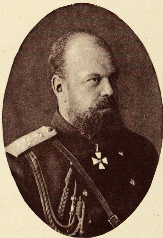
Государь Императоръ Александръ III.