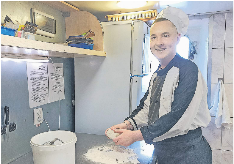
Корабельный пекарь за работой.