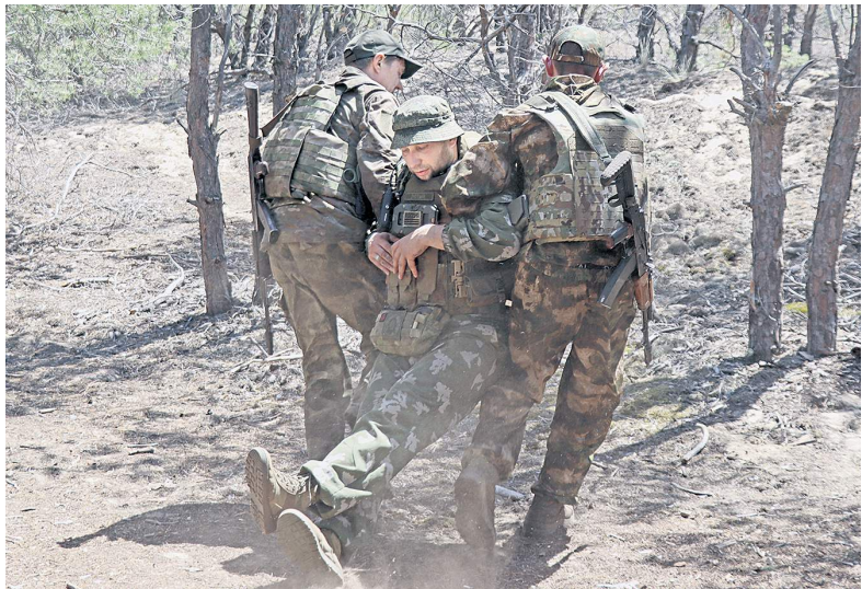
Эвакуация раненого – обязательная часть занятий по тактической медицине.

Медики на передовой давно получили неформальный статус «ангелов-хранителей» среди наших бойцов. Они вытягивают раненых из лап смерти, оказывая первую помощь там, где свистят пули и разрываются снаряды.