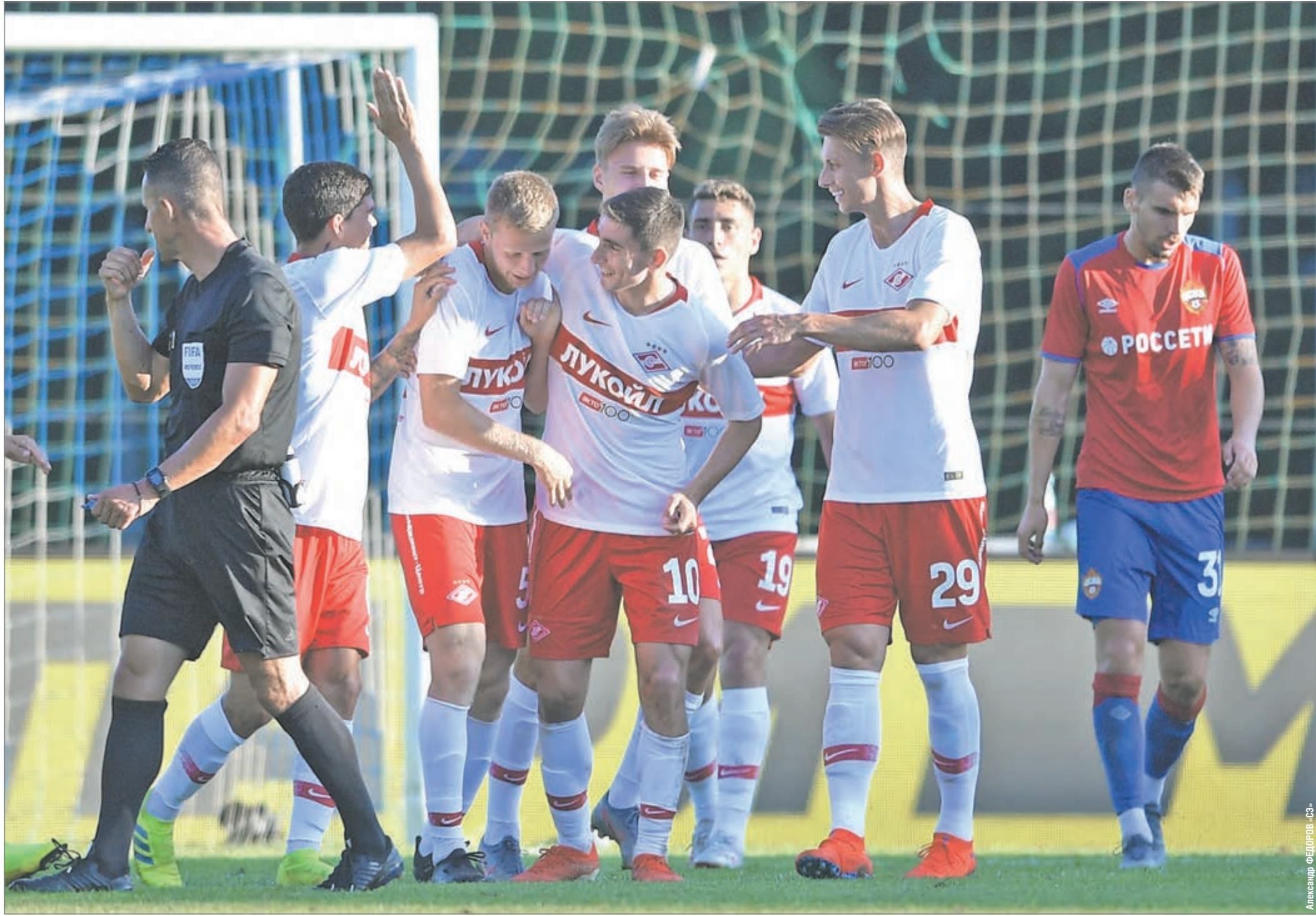
Вчера. Пеллау. «Спартак» - ЦСКА - 3:1. Красно-белые празднуют победу в дерби.

Вчера красно-белые одержали победу над ЦСКА (3:1) на турнире в Австрии. Этот матч ничего не значил в глобальном смысле - до начала официальных встреч еще довольно далеко. Но любой другой результат мог погрузить спартаковцев в пучину негатива.