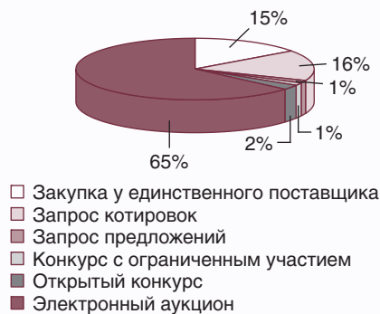
Диаграмма 1. Количество извещений в I–II кварталах 2014 г.

На основании изложенного Минэкономразвития России отмечает, что в рамках формирования контрактной системы отмечены следующие положительные тенденции: в части проведения электронных аукционов – увеличение количества объявленных электронных аукционов (диаграмма 3), что обусловлено сокращением закупок товаров, работ, услуг у единствен-