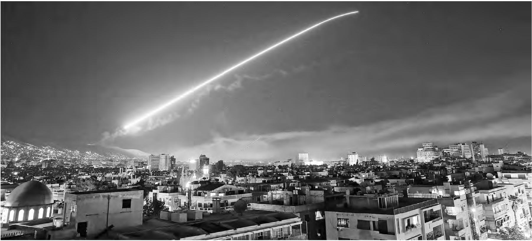
Для отражения воздушных атак сирийские военные действовали комплексы ПВО советского производства С-125, С-200, «Бук», «Квадрат» и «Оса».

позиция Владимир Путин сделал заявление РАЗРУШАЮТ СИСТЕМУ МЕЖДУНАРОДНЫХ ОТНОШЕНИЙ