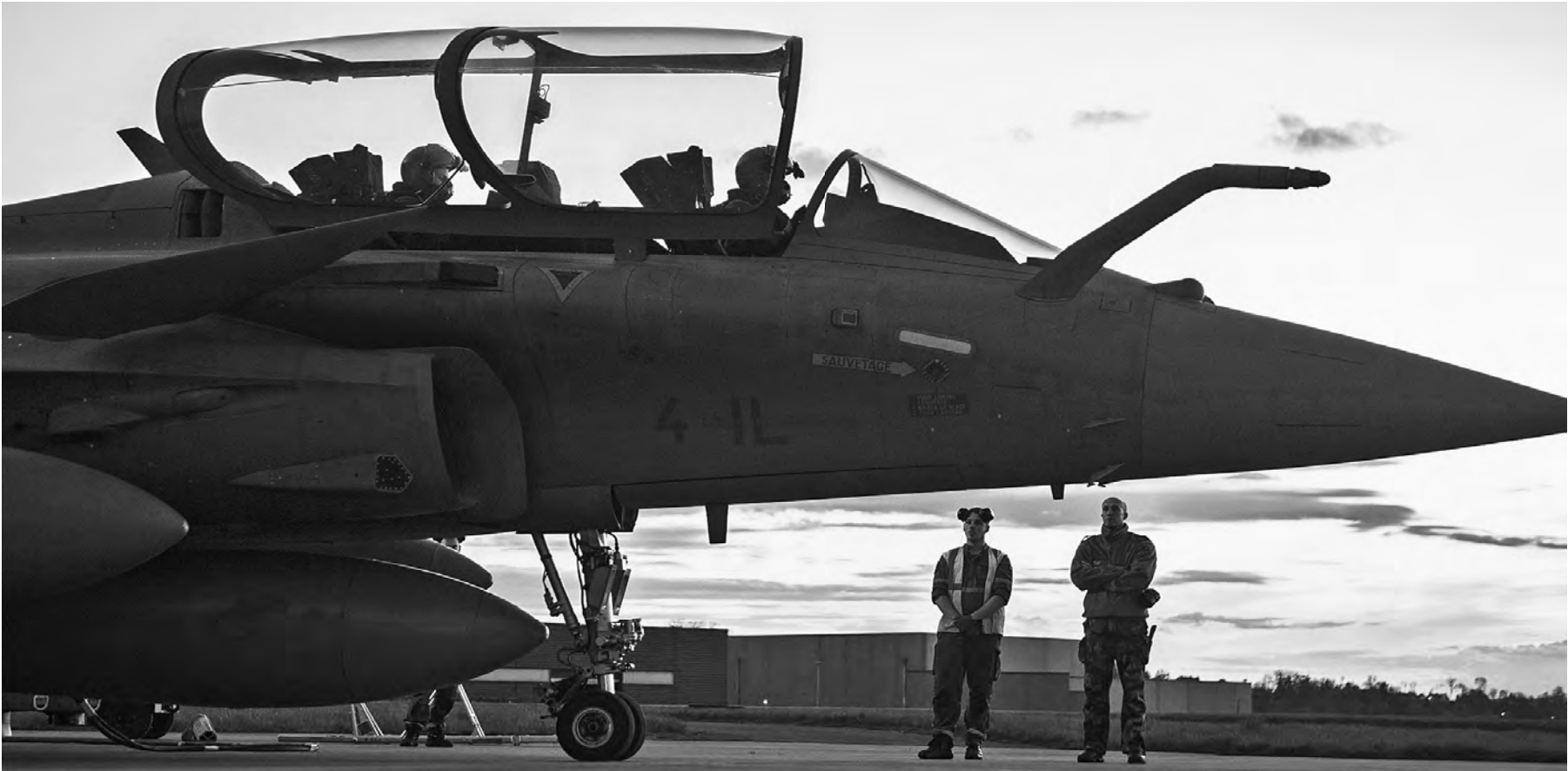
США и их союзники обрушили на Сирию всю свою воздушную мощь.... (Генштаб РФ не обнаружил ракетных ударов только истребителей «Рафаль»).