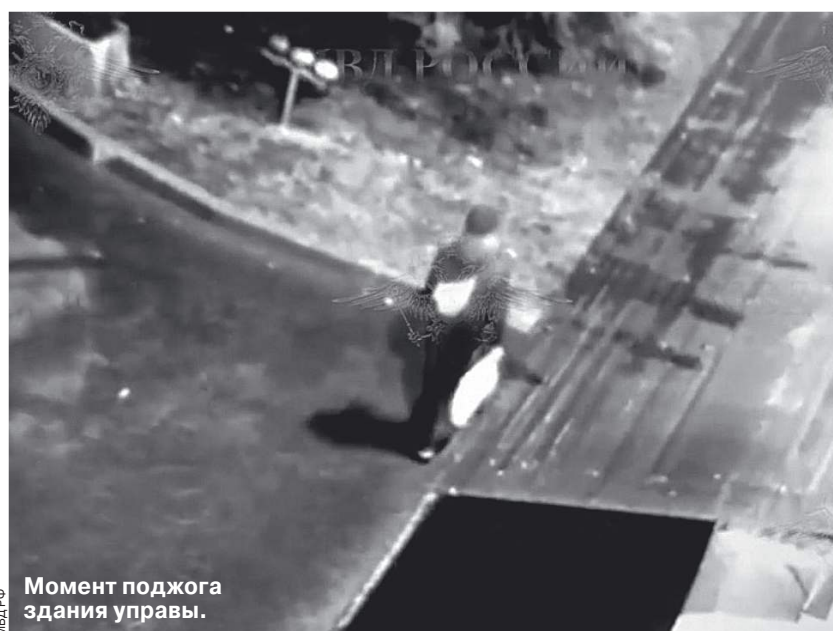
Момент поджога здания управы.