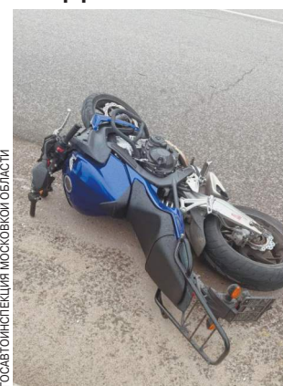
ГОСПОИШТЕЛЬНИКА МОСКОВСКОЙ ОБЛАСТИ

Как стало известно «МК», трагедия произошла около 15.20. Водитель грузового автомобиля «Хендай», который занимался перевозками грузов уже более 20 лет, заехал в магазин автозапчастей. Он остановился напротив торговой точки и отправился за покупками. Пробыв в магазине совсем недолго, шофер поспешил обратно, но не посмотрел по сторонам и тут же был сбит мотоциклом «Хендай». В этом месте нет пешеходного перехода, и