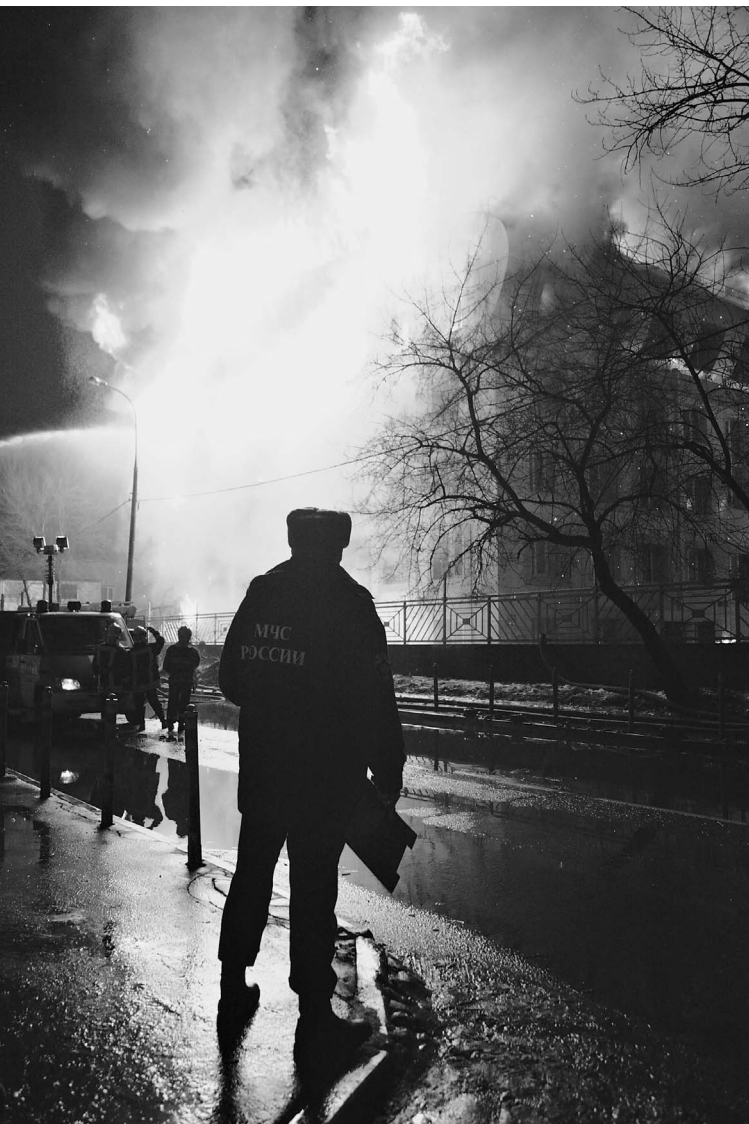
В считанные минуты огонь охватил здание

Страшный пожар произошел в субботу вечером в бизнес-центре на севере Москвы. Огонь охватил 1,8 тысячи квадратных метров, его тушили пять часов. Из здания были эвакуированы пять человек, жертв и пострадавших среди работников и посетителей центра удалось избежать, однако погиб начальник службы пожаротушения Москвы полковник внутренней службы Евгений Чернышев.