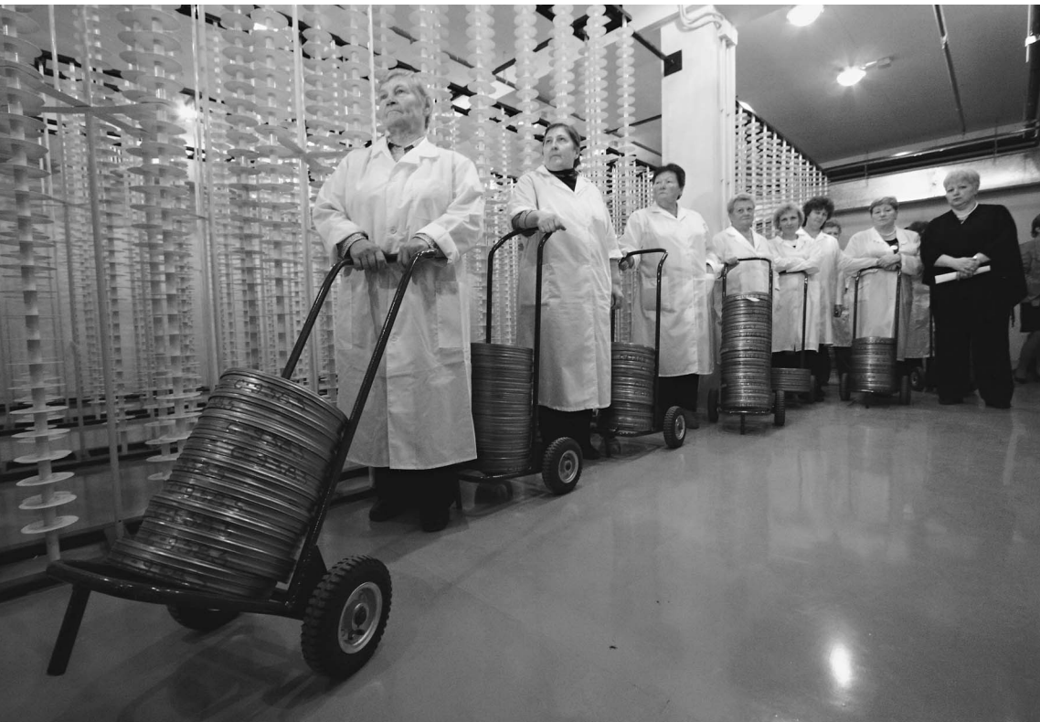
Госфильмофонд готовится пополниться новыми отечественными картинами, снятыми за государственный счет

ОФИЦИАЛЬНЫЕ (ЦЕНТРАЛЬНЫЙ БАНК РФ) КУРСЫ ВАЛЮТ К РУБЛЮ НА 20 МАРТА