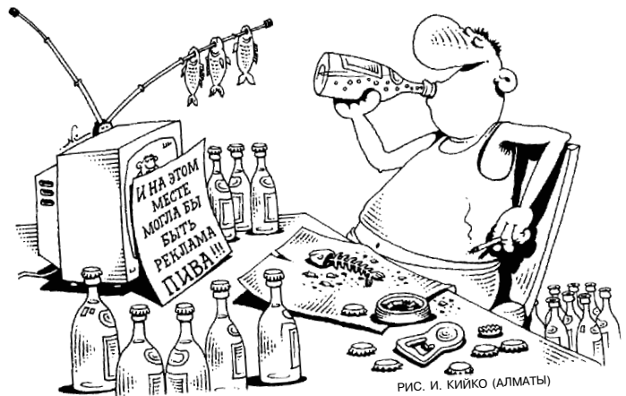
РИС. И. КИЙКО (АЛМАТЫ)

В апрельский номер мы, как обычно, включили всё, что пришло нам в голову, а также всё, что пришло по почте к нам в редакцию за апрельский месяц. А это: письма от читателей и многое другое. Обычный весенний набор. Небыстрого вам чтения и вдумчивого негромкого смеха.