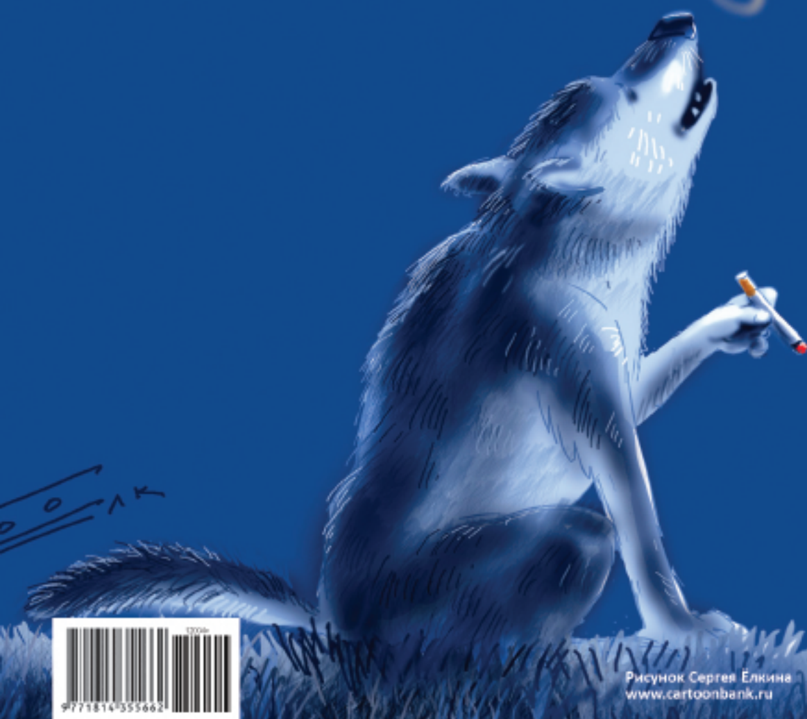
Рисунок Сергея Елкина www.cartoonbank.ru