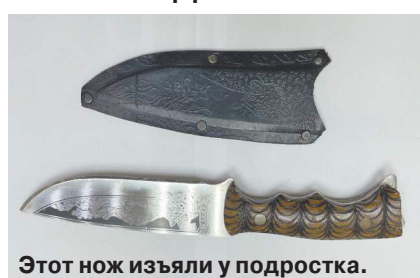
Этот нож изъяли у подростка.

Нпадение на школу предотвратили спецслужбы в подмосковном Реутове. 16-летний подозреваемый обучался в этом же заведении, в 10-м классе. Как стало известно «МК», юноша — уроженец Таджикистана. По версии следствия, он вступил в одной из соцсетей в группу «Колумбайн» (террористическая организация, запрещенная в РФ). В группе неоднократно обсуждались варианты нападения на общеобразовательные учреждения. По всей видимости, подросток проникся идеями интернет-друзей и решил организовать нападение на свою альма-матер. Однако о его страшных планах узнали сотрудники ФСБ, и десятиклассника задержали. В ходе обыска у него изъяли три ножа и многочисленные записки. По словам родных, мальчик очень хорошо учился, всегда готовился к занятиям, помогал по дому матери и часто проводил время с 4-летним братом, играя с ним по вечерам. С 5-го по 9-й класс он посещал кадетское подразделение, в 10-м распределен в класс по социально-гуманитарному профилю. Педагоги отмечают, что парень без проблем выполнял домашние задания. О проблемах в школе десятиклассник не говорил