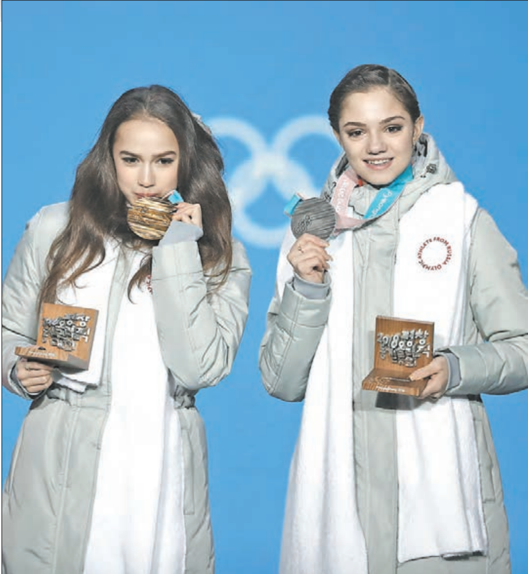
Главное, что случилось со сборной России на этой Олимпиаде: золото хоккеистов и двойной успех фигуристок Алины ЗАГИТОВОЙ и Евгении МЕДВЕДЕВОЙ (справа).