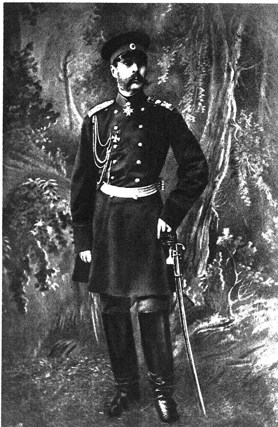
12 Императоръ Александръ II.