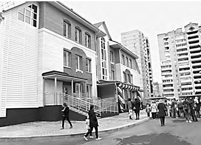
С открытием этого здания очередь в детсады Ижевска немного сократилась.

ХОРОШАЯ НОВОСТЬ Новое дошкольное образовательное учреждение открыли в Ижевске на улице Берша. Дополнительное здание детского сада № 259 рассчитано на 220 малышей в возрасте от 1,5 года. На первом этаже здания расположились младшие группы, медкабинет и пищеблок. На втором — младшие и средние группы, а также музыкальный зал и кабинет психолога. На третьем — старшие и подготовительные группы, спортивный зал, методический кабинет, изостудия. На территории детского сада расположены 12 прогулочных участков с кирпичными верандами, песочницами, игровым оборудованием. — Здание построено по федеральной целевой программе «Жилище» при поддержке федерального и регионального бюджетов, — говорит Сергей Задорожный, министр образования и науки Удмуртии. — В этом году планируем завершить строительство детсада на улице Баранова. Дошкольные учреждения в ближайшие годы будут появляться во всех районах новостроек. Камиля Апекова, Ижевск