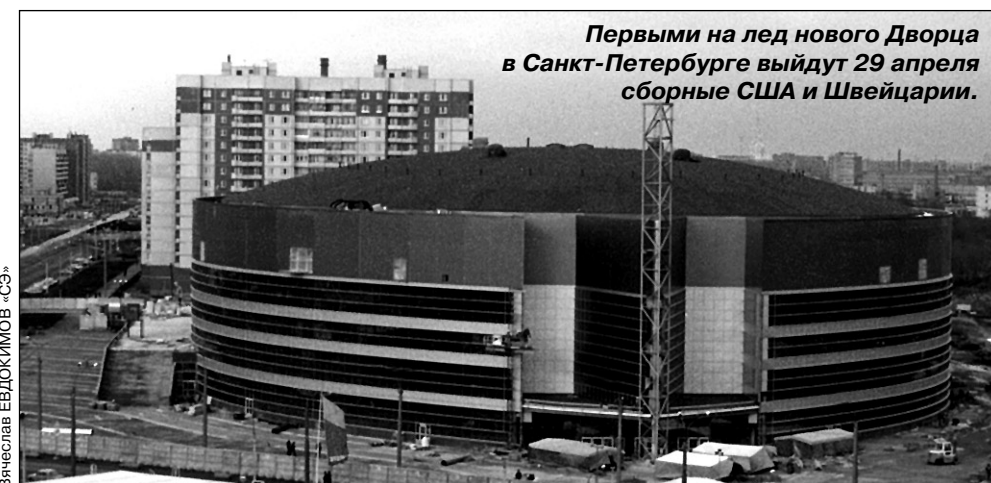
Первыми на лед нового Дворца в Санкт-Петербурге выйдут 29 апреля сборные США и Швейцарии.

Ровно через месяц - 29 апреля - в Санкт-Петербурге начнется 64-й чемпионат мира. Наша страна уже четыре раза была хозяйкой мировых первенств, причем всегда сильнейшие сборные планеты принимала Москва - в 1957, 1973, 1979 и 1986 годах. В конце весны Санкт-Петербург ждет своего рода дебют. Тем не менее в том, что турнир будет организован на высочайшем уровне, сомневаться не приходится. Россия - страна гостеприимная, что могут подтвердить участники проходивших у нас чемпионатов мира. И самое время вспомнить, как это было.