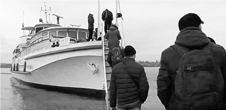
Каждый день с острова в город и обратно переезжают сто человек.