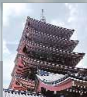
«Японизация» финансовых рынков

Подписные индексы: 47743 по каталогу «Роспечать», 40917 по каталогу «Пресса России», 99720 по каталогу «Почта России»