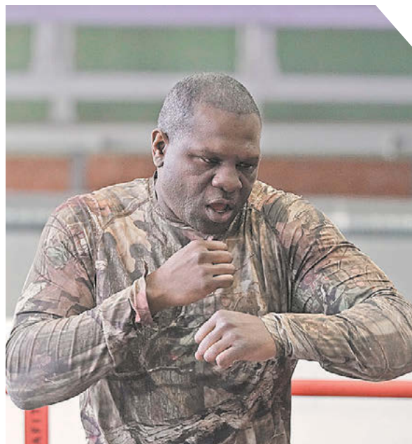
Здурд Корниенко «Известия»