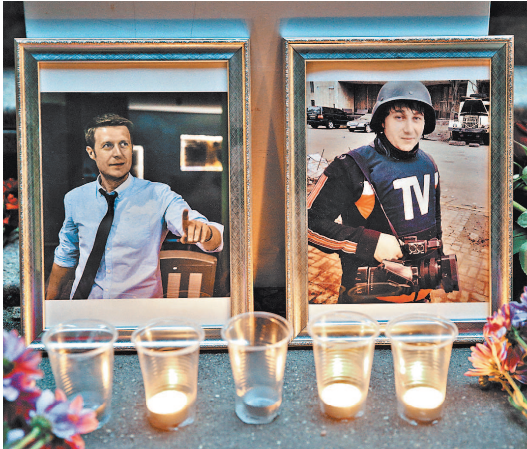
Этот снимок был сделан 17 июня 2014 года у здания ВГТРК. Цветы и свечи в память о погибших журналистах.

Напомним, 22 марта Донецкий городской суд Ростовской области признал Надежду Савченко причастной к гибели на Донбассе двух тележурналистов ВГТРК. Именно она 17 июня 2014 года по радиосвязи корректировала огонь украинских гаубиц Д-30, которые находились у поселка Веселая Гора под Луганском.