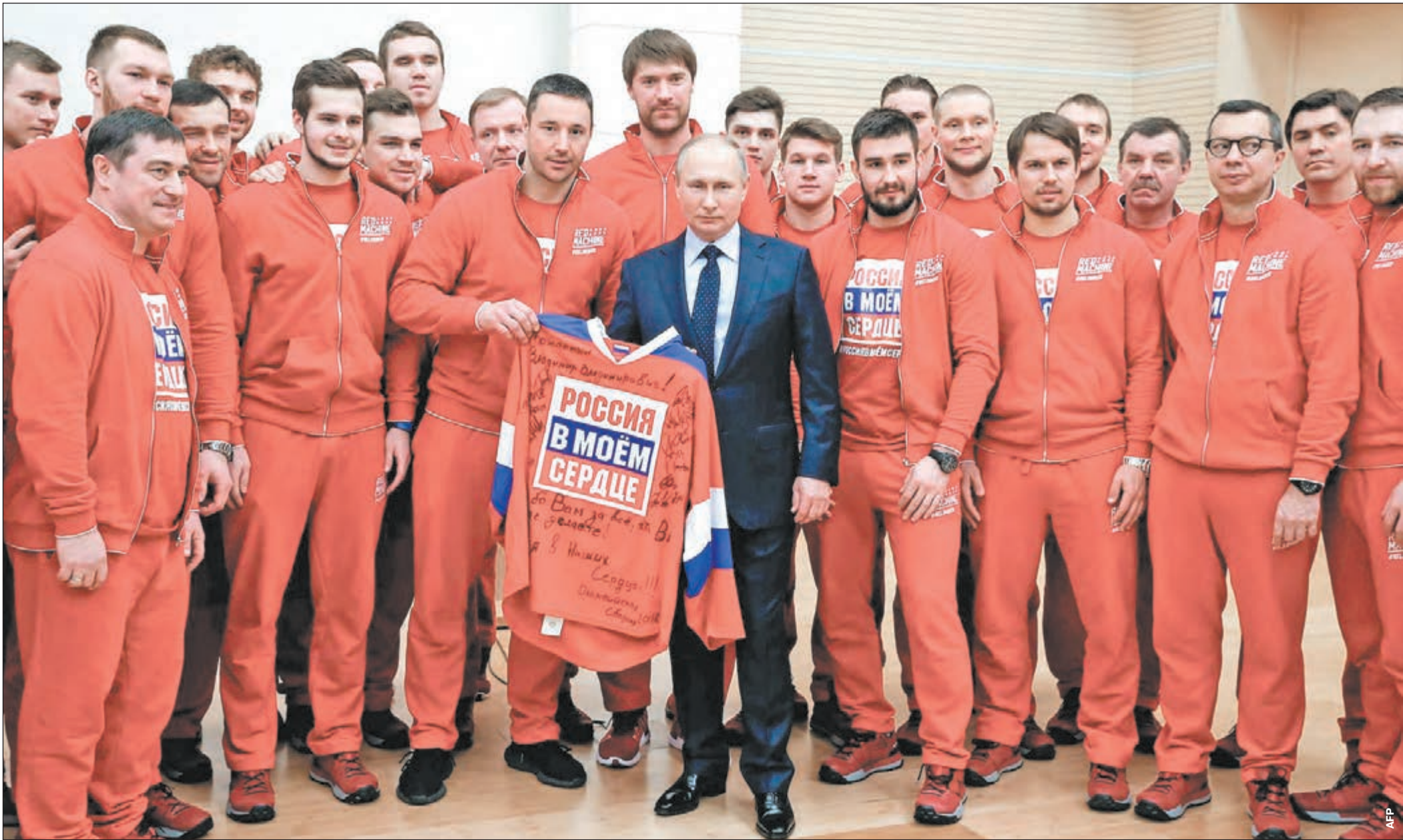
Вчера. Ново-Огарево. Владимир ПУТИН со сборной России по хоккею.

Вчера Президент России в своей резиденции принял спортсменов, которые отправятся на Олимпиаду в Пхенчхан. На встрече прозвучали важные слова.