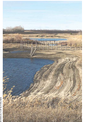
Все, что осталось от обмелевшего водохранилища.

Городские охотники за цветметом чаще нацеливаются на чугунные люки уличных колодцев. В 2022-м в Тюмени похитили 83 крышки, за 10 месяцев нынешнего года — 62.