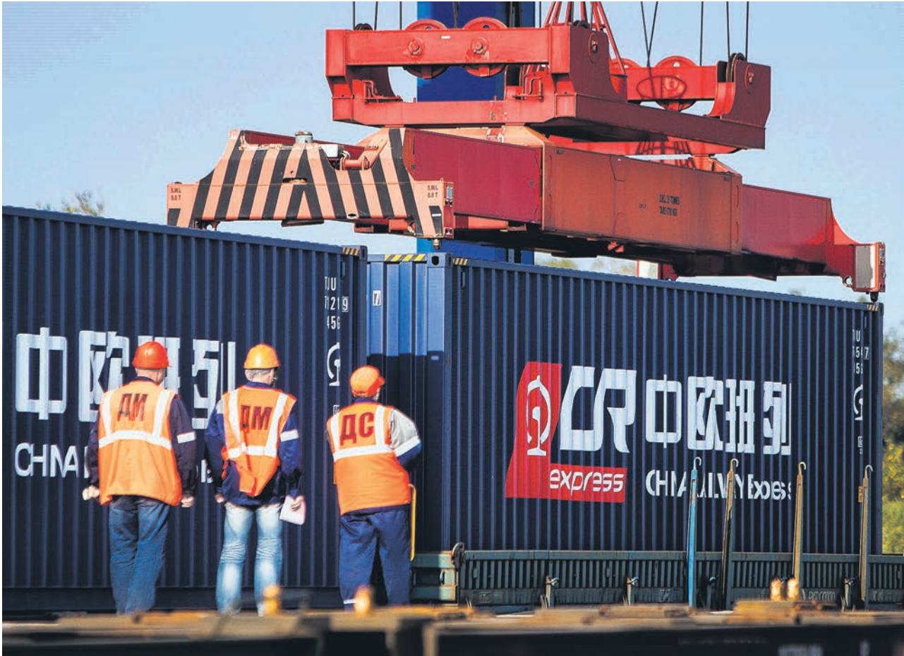
Взаимные поставки РФ—КНР растут, хотя и сталкиваются со сложностями в проведении расчетов и проблемами сжатия внутреннего спроса в Китае

За восемь месяцев 2024 года товарооборот Китая и РФ вырос на 1,9% к такому же периоду 2023 года и достиг $158,47 млрд, сообщила ГТУ КНР. Поставки из России увеличились на 13%, до $8,3 млрд (см. „Ъ“ от 14 мая). После этого, в июне, США расширили список параметров, по которым можно вводить санкции за экспорт в Россию товаров двойного назначения. Именно тогда российские экспортеры стали заявлять о возникновении