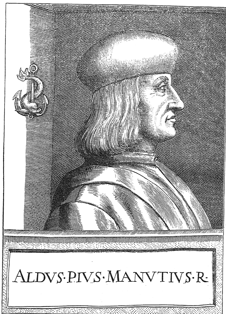
ALDE MANUCE d'après une estampe du temps.