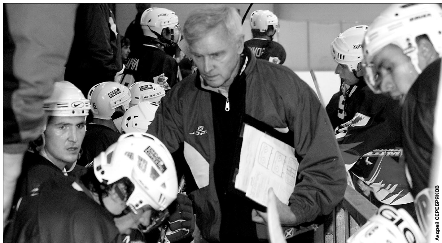
Вчера. Магнитогорск. «Металлург» Мг - «Молот-Прикамье» - 2:2. Скамейка запасных «Металлурга». В центре - главный тренер Дэйв КИНГ.

Интервью Дэйва Кинга корреспонденту «СЭ» - стр. 7