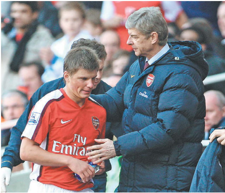
2009 год. Лондон. Андрей Аршавин и Арсен Венгер