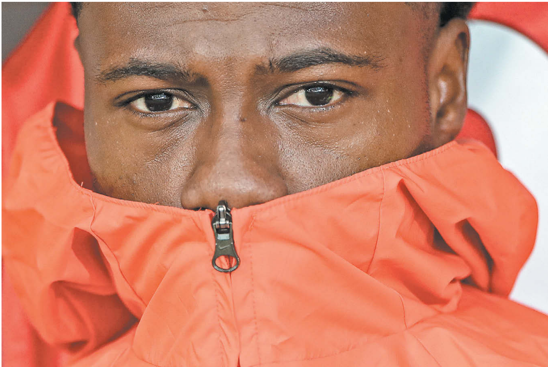
Лидер «Спартак» Квинси Промес

Вчера стало известно, что суд Амстердама признал лучшего футболиста красно-белых виновным в нанесении ножевого ранения своему двоюродному брату в 2020 году и назначил форварду наказание в виде 18 месяцев тюрьмы