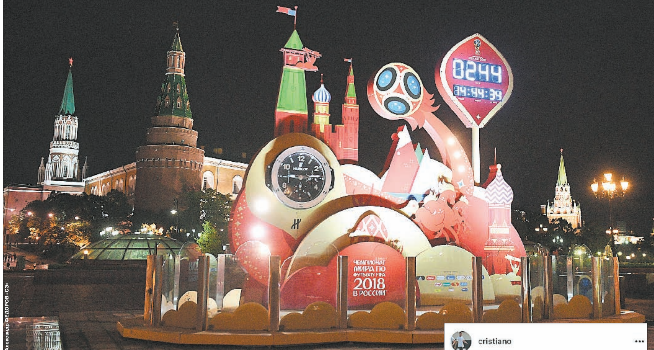
Вчера. Часы в центре Москвы с обратным отсчетом до ЧМ-2018.

ЧМ-2018 становится ближе: звезды все чаще говорят о России, определены уже 23 участника, еще 9 мест будут разыграны совсем скоро, а вчера завершился первый этап продажи билетов