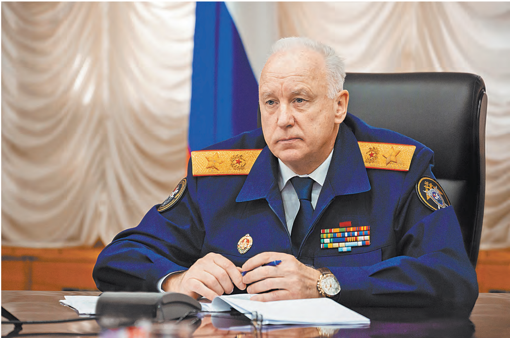
СЛЕДСТВЕННЫЙ КОМИТЕТ РФ