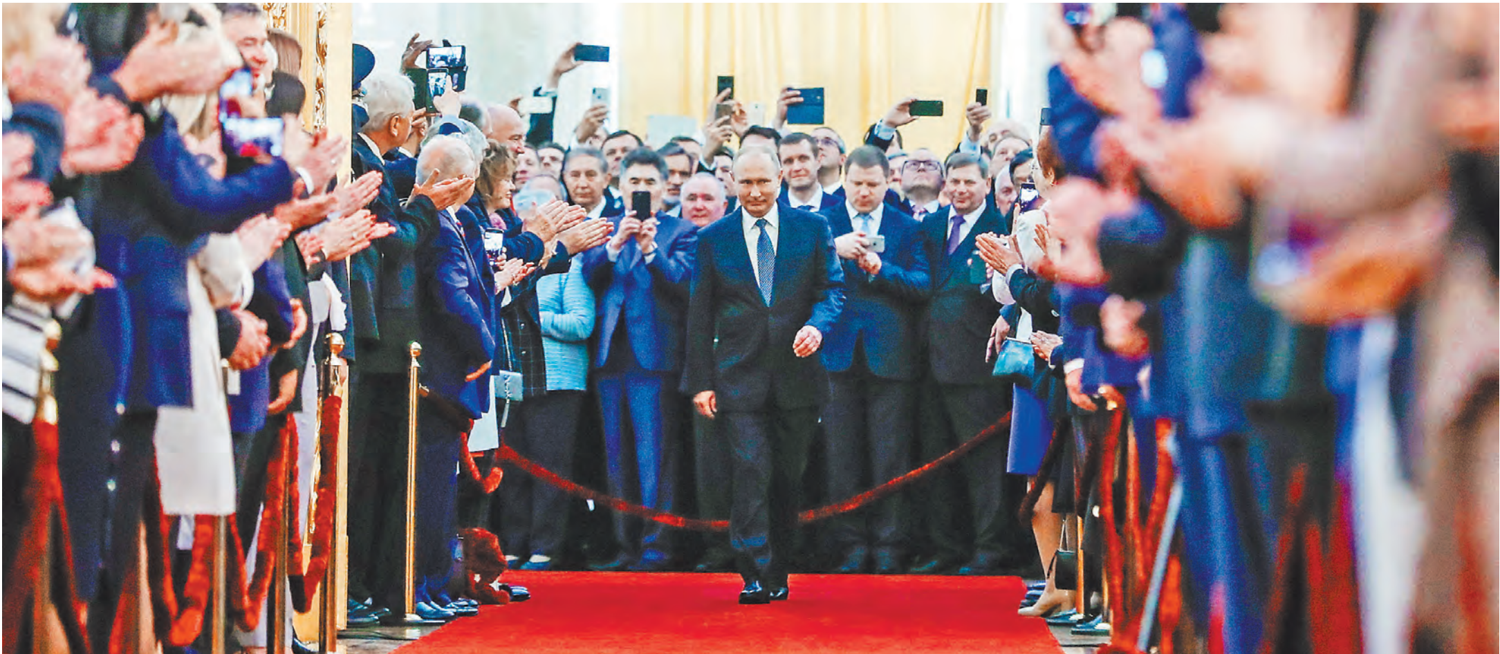
Присутствующие на церемонии в Большом Кремлевском дворце встречали появившегося на красной дорожке избранного президента России аплодисментами.