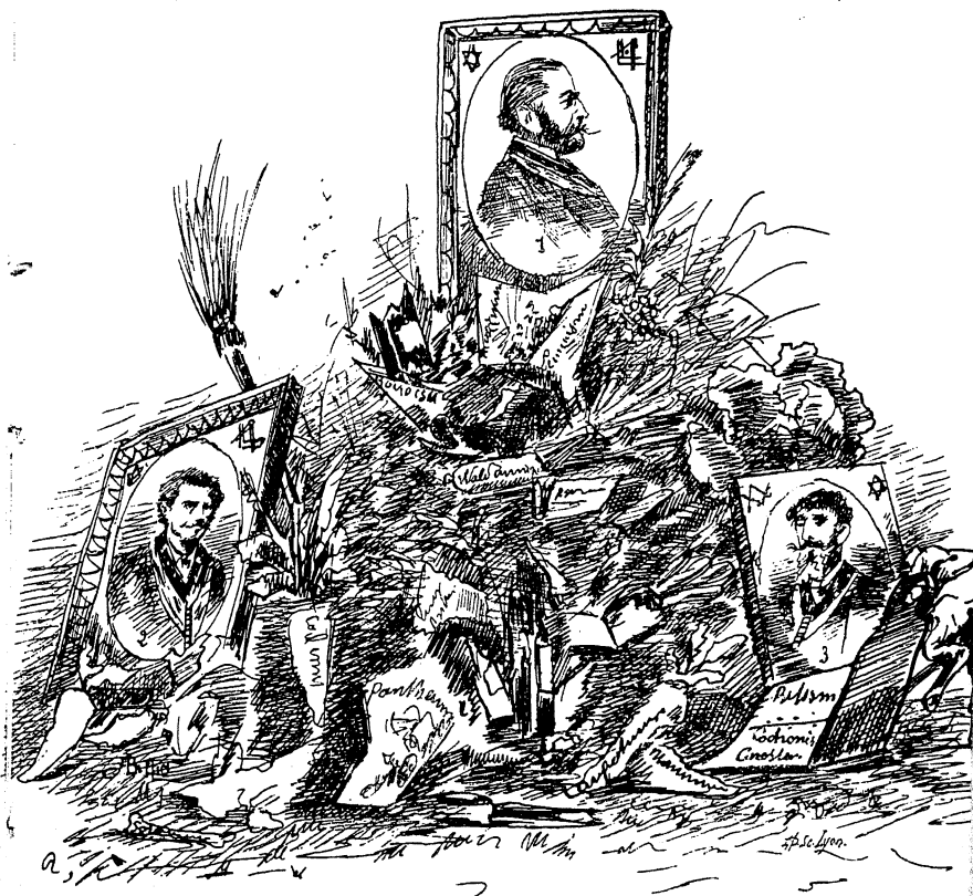
1. — Le F. ADRIANO LEMMI-LE-FRIPON