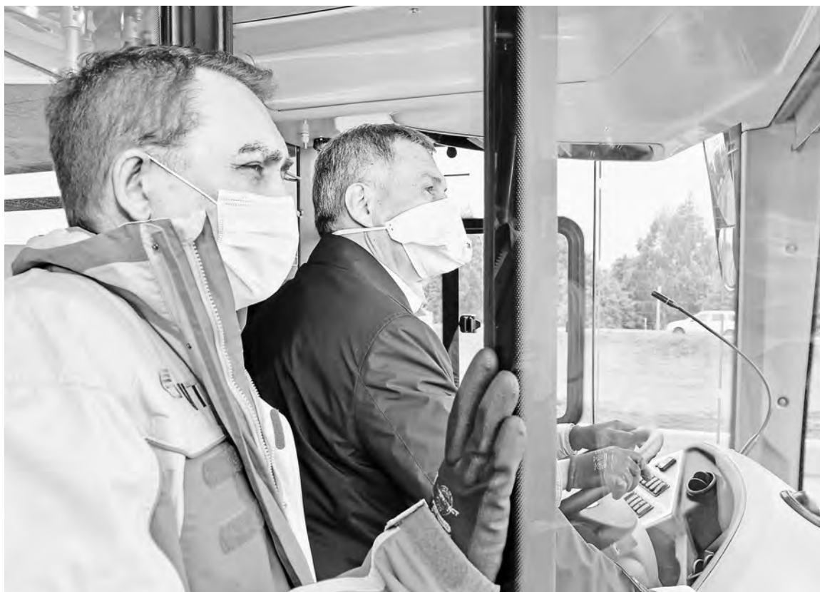
ПРЕСС-СЛУЖБА ПРЕЗИДЕНТА РТ

Разработка челнинского автогиганта поможет сохранить экологию и сэкономить деньги