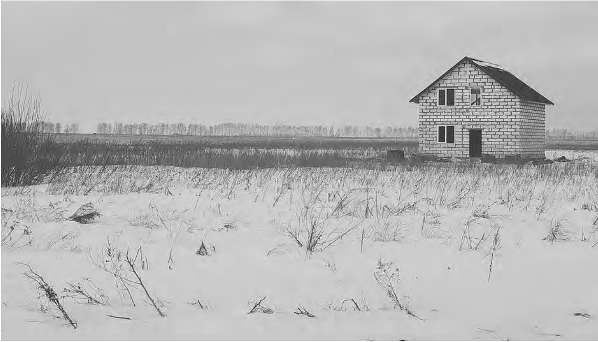
НА «ОНЛАЙН ТАМБОВ»