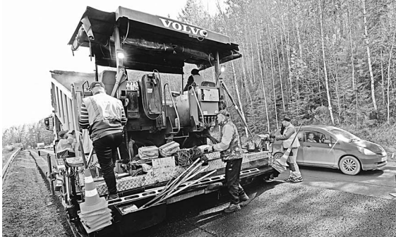
Ремонт трасс идет полным ходом.

Дорожные службы завершили поэтапный ремонт автодороги Избоищи — Наумовское — Кабожа в Чагодощенском районе. Трасса связывает регион с Новгородской областью. Работы были реализованы благодаря федеральному нацпроекту «Безопасные качественные дороги». В этом году по нацпроекту также стартовали работы на автодороге, которая связывает Вологодчину