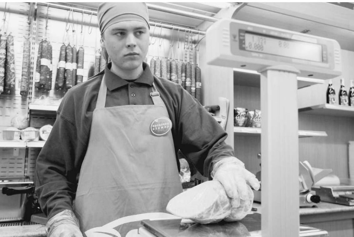
Каждый раз в магазине как первый: ЦЕННИКИ МЕНЯЮТСЯ НА ГЛАЗАХ

тели, скажем, хлеба, которые летом «просто так» поднимали цены, пользуются только поддержкой чиновников-лоббистов. Потому что им так выгодно. → стр. 7