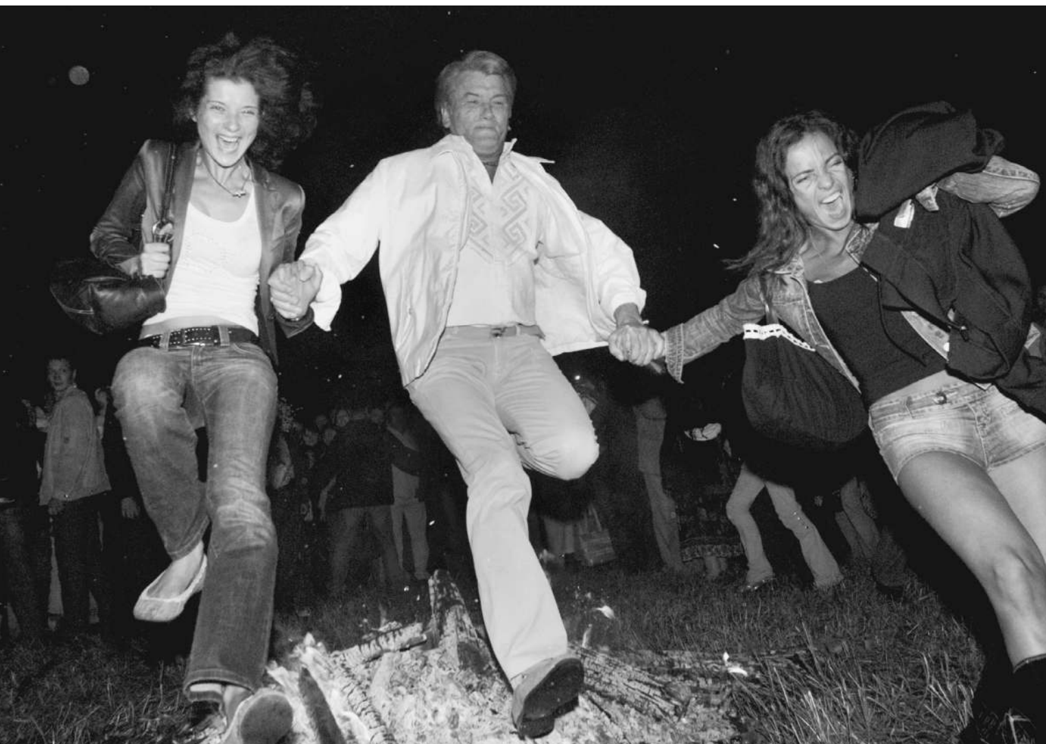
Виктор Ющенко в последние годы только и делает, что прыгает через костер — то реальный, то политический

Перед таким выбором поставила президента Ющенко Партия регионов