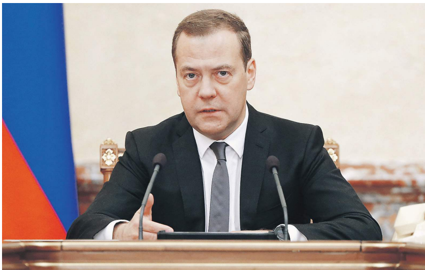
Премьер-министр Дмитрий Медведев назвал повышение пенсионного возраста непростым, но необходимым решением

Правительство предложило повысить пенсионный возраст. Эта мера необходима для увеличения благосостояния населения: в ближайшей перспективе размер пенсий будет расти примерно на 1 тыс. рублей в год. Кроме того, инициатива кабмина призвана изменить ситуацию на рынке труда, при которой желающих продолжить карьеру россиян «выталкивают» на заслуженный отдых. Правительство также