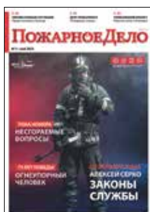
На обложке номера – защитная экипировка для пожарных и спасателей производства ГК «Энергоконтракт» (на правах рекламы) Дизайн – Ирина Томозова