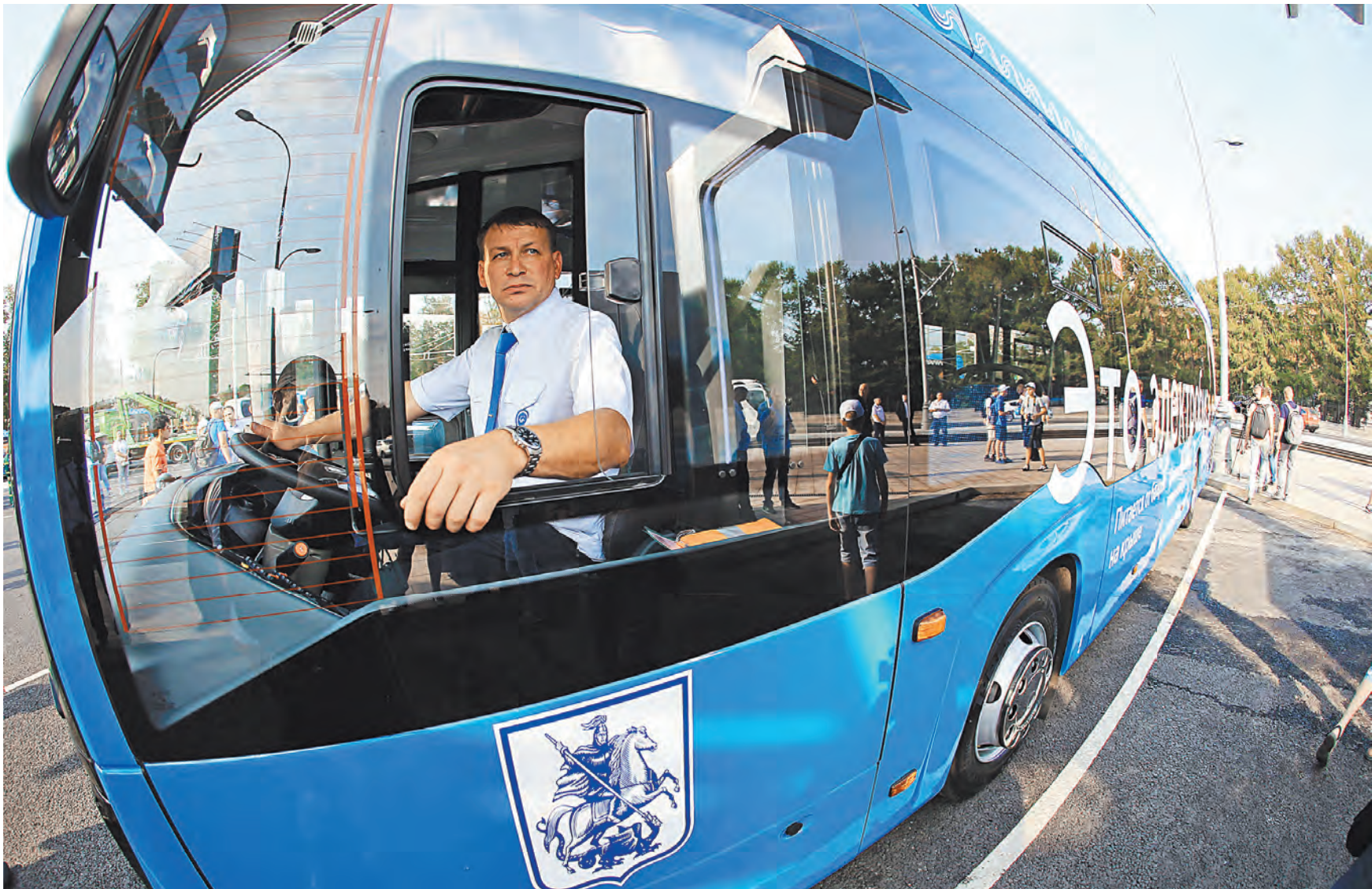
К 2030 году в Москве планируют заменить все автобусы на электробусы.