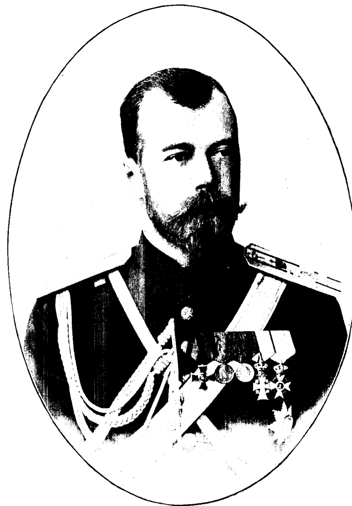
ЕГО ИМПЕРАТОРСКОЕ ВЕЛИЧЕСТВО ГОСУДАРЬ ИМПЕРАТОРЪ НИКОЛАЙ АЛЕКСАНДРОВИЧЪ САМОДЕРЖЕЦЪ ВСЕРОССИЙСКИЙ.

Печатано по распоряженію СПб. Городского Головы.