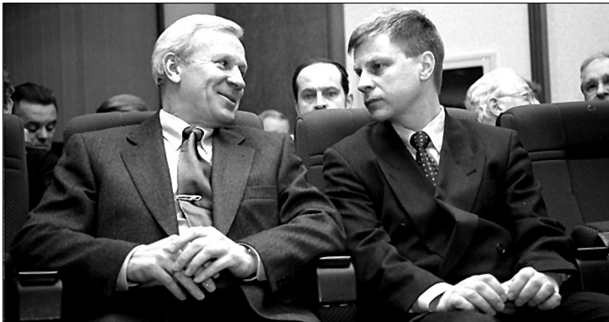
Президент РФС Вячеслав КОЛОСКОВ (слева) и его заместитель Николай ТОЛСТЫХ: есть календарь!

обусловлен соблюдением интересов болельщиков. По взаимной договоренности с представителями «Алании» и «Уралана» из-за участия нашей команды в Кубке УЕФА мы скорректировали сроки проведения гостевых матчей с этими клубами. Конечно, и у нас будет тяжелый отрезок, когда подряд играем со «Спартаком» и «Торпедо», но трудностей не избежал, по-моему, никто. Наибольшие претензии к календарю вновь были в этом случае у торпедовцев, возникла бы пауза в 19 дней - а в середине осени, сами понимаете, чем-то ее заполнить сложно. В итоге был найден компромиссный вариант - 14 октября проводим матч 1/16 Кубка России. Поэтому мы дали согласие на перенос игры со «Спартаком».