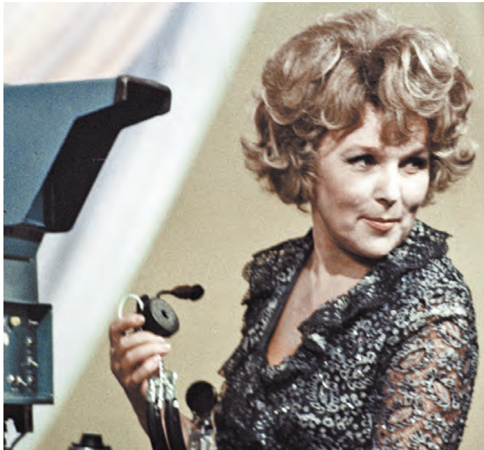
Актриса считает, что краткий характер она унаследовала от отца, а мечтательность — от матери.

АНОНС / На международном музыкальном фестивале в Минске отличились россияне А эта «Сильва» пела и плясала