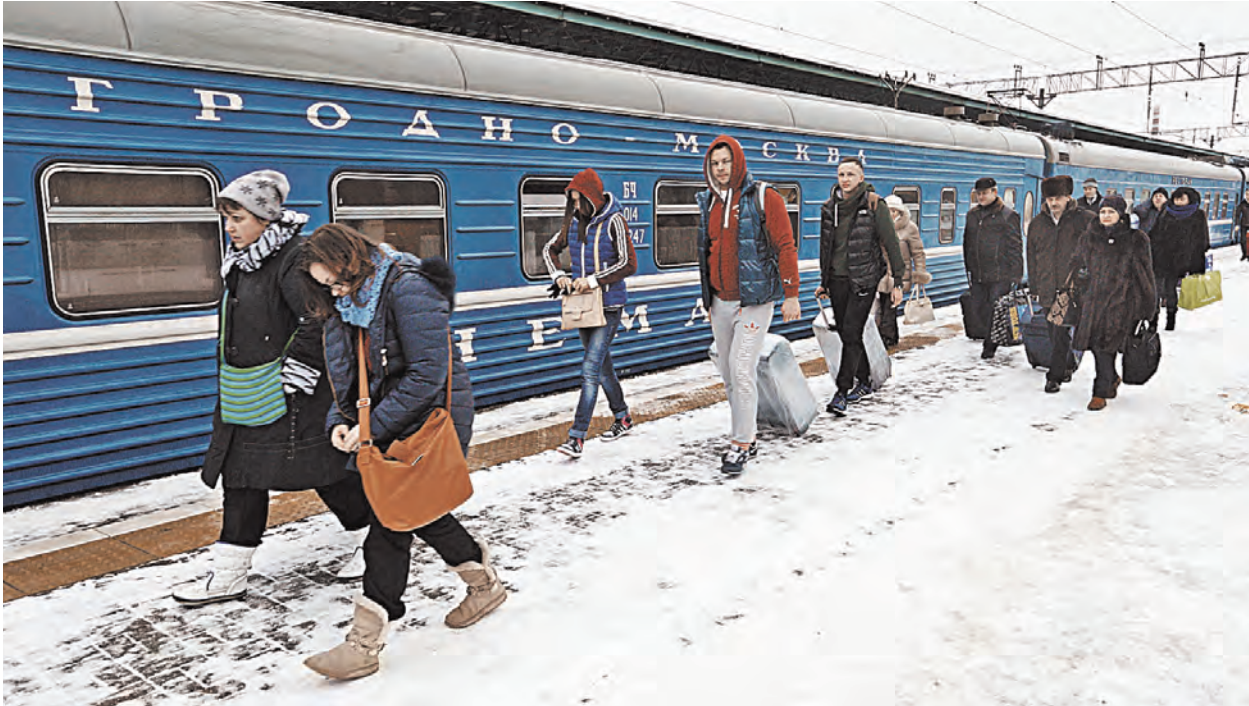
Ежедневно между Москвой и крупными белорусскими городами курсируют девять пассажирских поездов.

граждан Беларуси и России, но и нормы по взаимному признанию решений от отказе во въезде иностранных граждан на территорию Беларуси и России, по ограничению на выезд граждан обеих стран за пределы Союзного государства, по взаимодействию компетентных органов в обмене информацией банков данных по иностранным гражданам, по изменениям соглашения о миграционной карте единого образца.