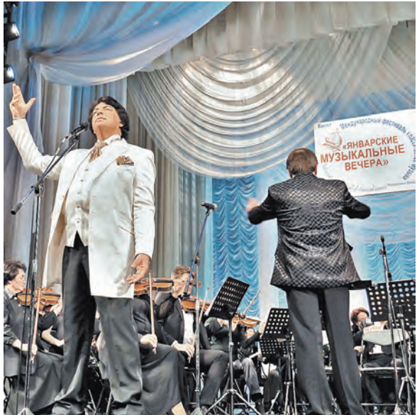
Публика долго не отпускала знаменитого «мистера Икс».