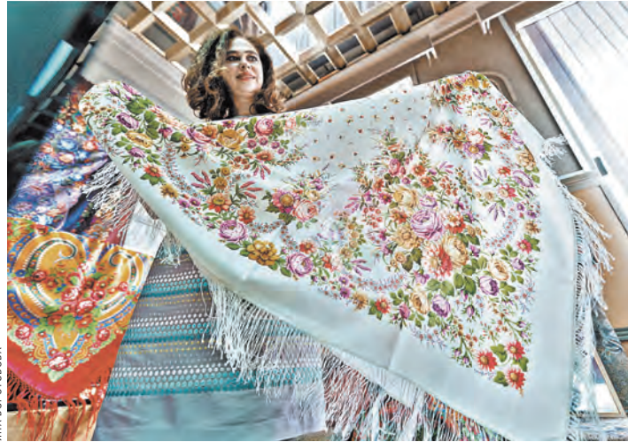
Павловпосадские шали (платки) — один из русских народных промыслов, ему в этом году исполняется 220 лет.

Вопросы поддержки народных промыслов решают по-прежнему... И ведомств: от Минпромторга и Минкультуры России до Минэкономразвития и Минсельхоза. А у семи нянек дитя, как известно, без глаза. Эксперты считают, что необходим единый федеральный центр, координирующий всю работу по сохранению промыслов, а также Совет при правительстве по сохранению и возрождению народных художественных промыслов России.