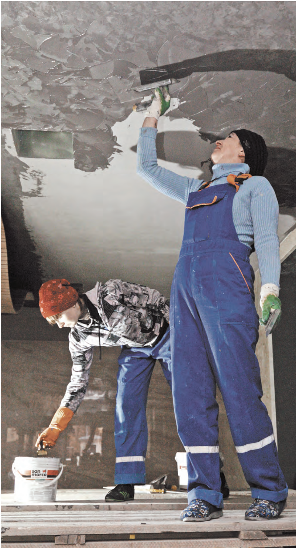
Этих белорусских девушек наш фотокорреспондент застал на рабочем месте — на строительном объекте в самом центре Москвы.