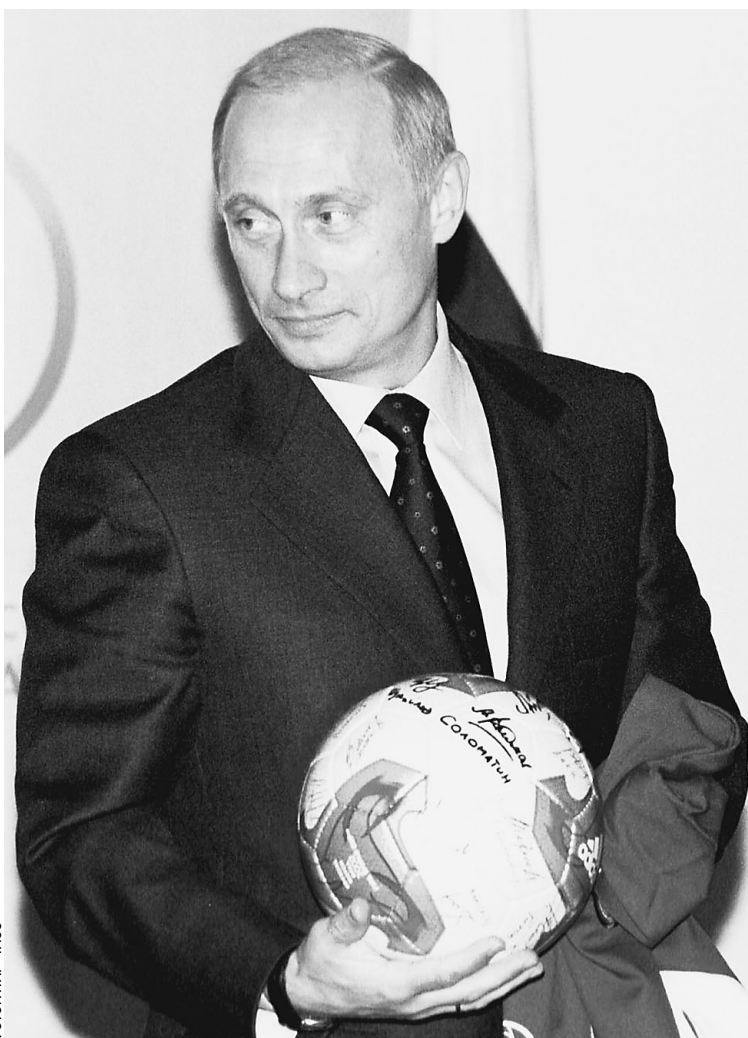
Владимир Путин вернул футбол народу

— Теперь рядовым болельщикам придется, во-первых, потратить деньги на приобретение специального оборудования, чтобы смотреть это через «НТВ-Плюс», и платить еще абонентскую плату — так оценил суть нового телефутбольного контракта президент России и обратился с просьбой к первому вице-премьеру. → стр. 2