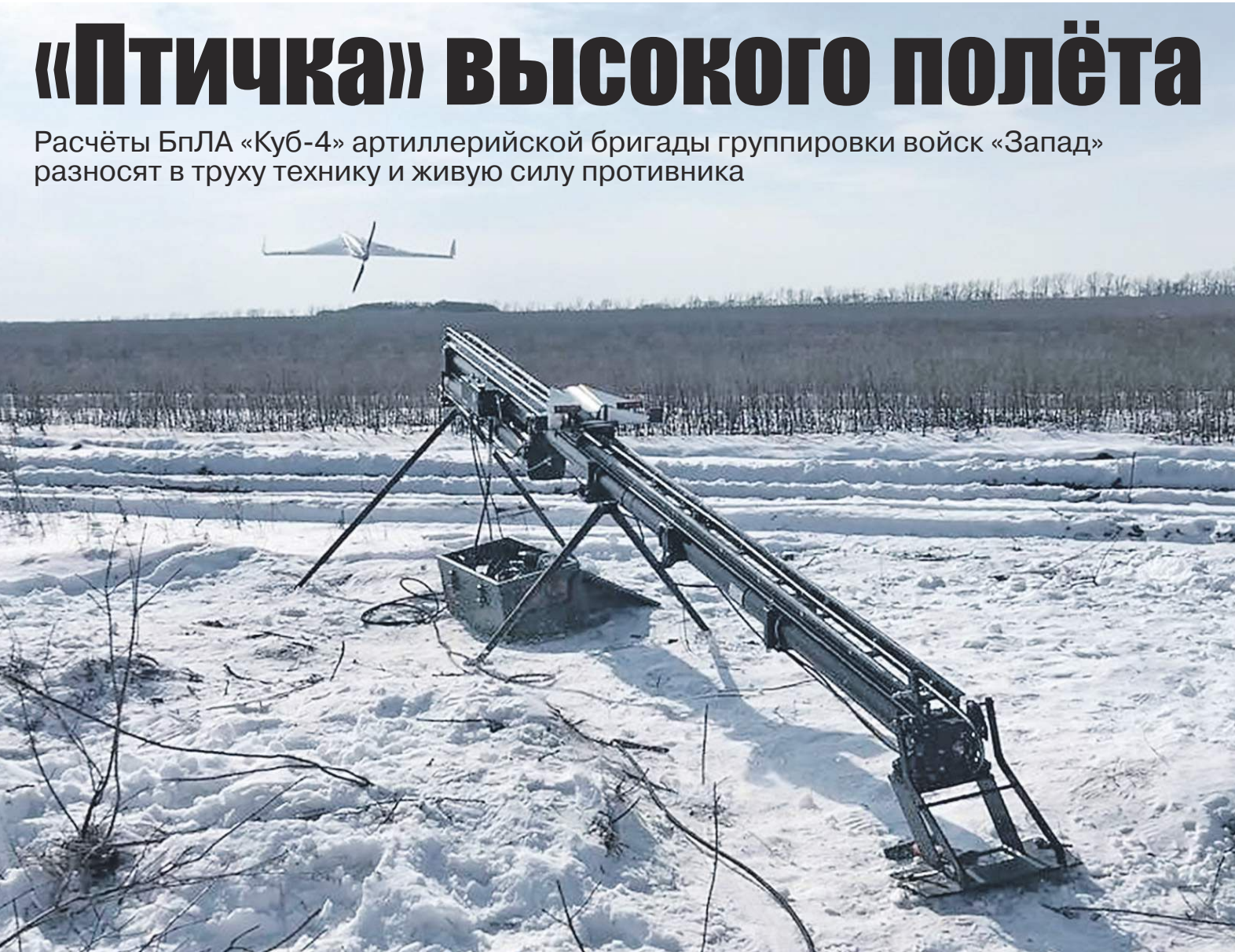
В поисках цели.

Высокоточные БпЛА «Куб-4» активно применяются в ходе специальной военной операции и представляют собой дроны-камикадзе, предназначенные для нанесения ударов по наземным целям. Данные беспилотники получили широкую популярность благодаря своей эффективности и относительно невысокой стоимости.