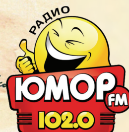
Рисунок Сергея Сыченко www.cartoonbank.ru