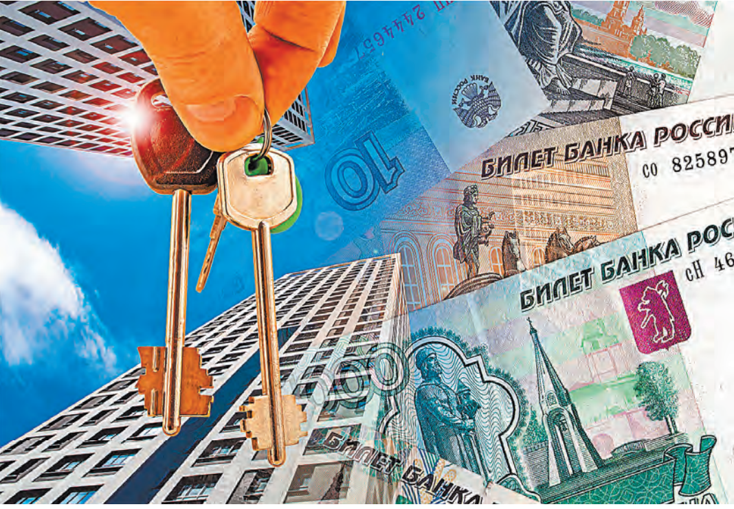
В среднем по стране накопить на квартиру семья может за 5,2 года, а если еще и снимает жилье, то уже за 9,2 года.