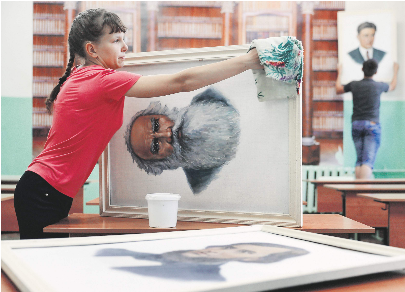
Владимир Сапрыкин / ТАСС