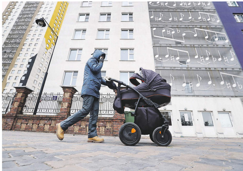
Михаил Гурченко / ИТАР-ТАСС