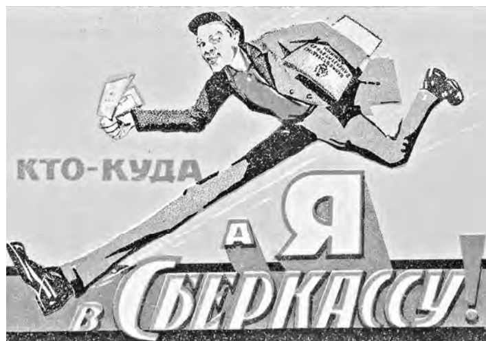
Обложка памятки бережливости для вкладчика сберегательной кассы. 1929 г.

Проект федерального бюджета на будущую трехлетку, который опубликован на федеральном портале проектов правовых актов и вчера обсуждался в правительстве, предполагает, что выплаты будут происходить по вкладам, открытым в Сбербанке,