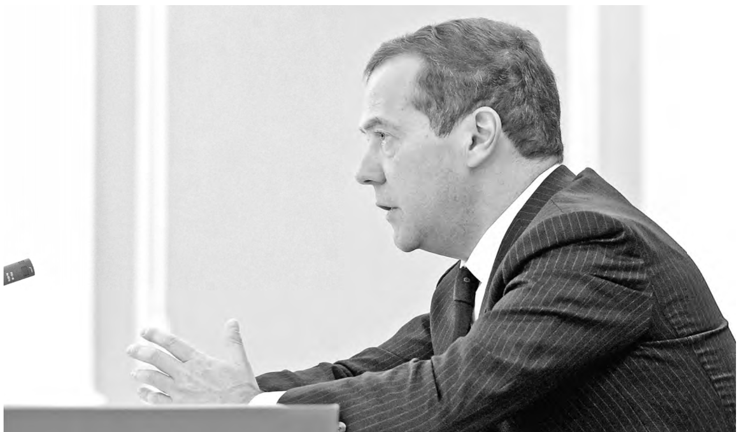
Глава правительства заверил, что как бы ни складывалась внешнеэкономическая обстановка, бюджет останется социально ориентированным.

Правительство В бюджете 2017 года сохранены все социальные обязательства