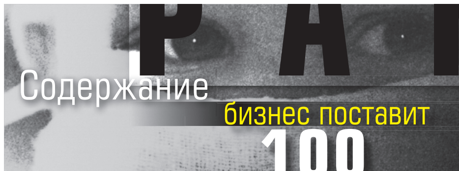
ОБЛОЖКА: КИРИЛЛ РУБЦОВ; ФОТОГРАФИКА ТАСС