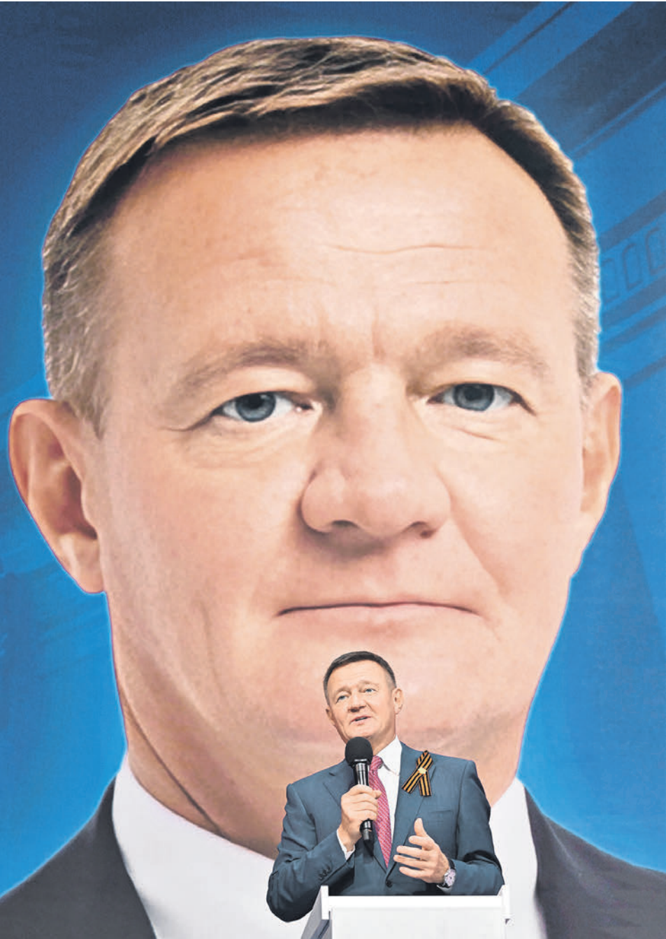
Роман Старовойт находился в последнее время под угрозой не только отставки, но и уголовного преследования

Активное расследование хищений при строительстве оборонительных сооружений на границе с Украиной началось в Курской области после отставки Романа Старовойта с поста губернатора в мае 2024 года (тогда он и возглавил