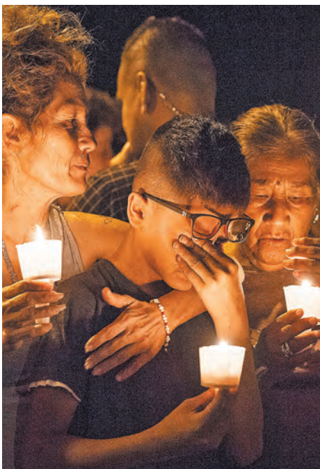
Жители Сатерленд Спрингс устроили ночное бдение в память о жертвах ужасной трагедии, потрясшей небольшой городок.

чп Бывший американский военный расстрелял 26 прихожан церкви Расстрельная молитва